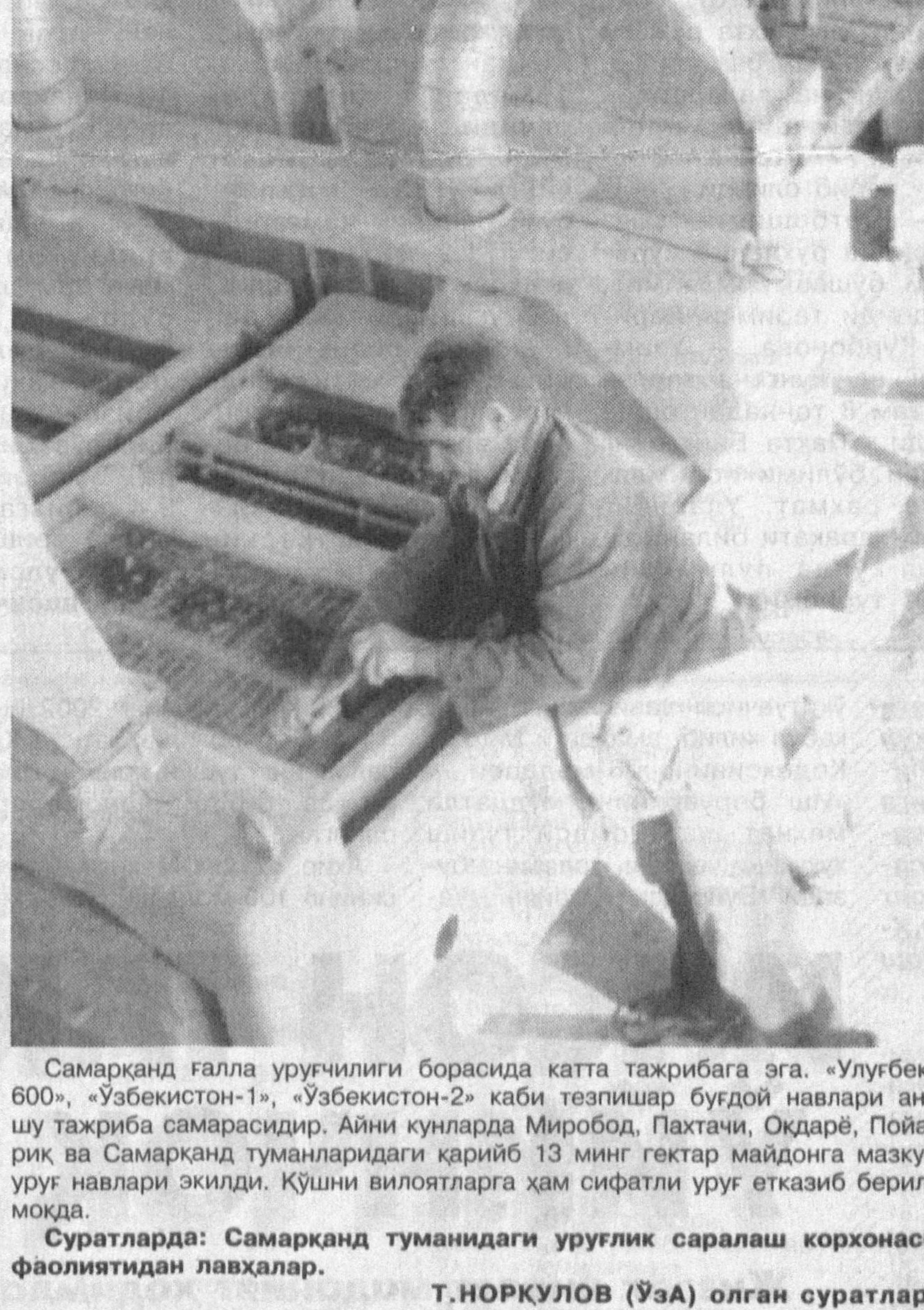
Самарқанд галла уруғчилиги борасида катта тажрибага эга. «Улғбек-600», «Ўзбекистон-1», «Ўзбекистон-2» каби тезпишир бугдой навлари ана шу тажриба самарасидир. Айни кунларда Миробод, Пахтачи, Оқдарё, Пойларик ва Самарқанд туманларидаги қариб 13 минг гектар майдонга мазкур уруғ навлари экилди. Қўшни вилоятларга ҳам сифатли уруғ етказиб берилмоқда.