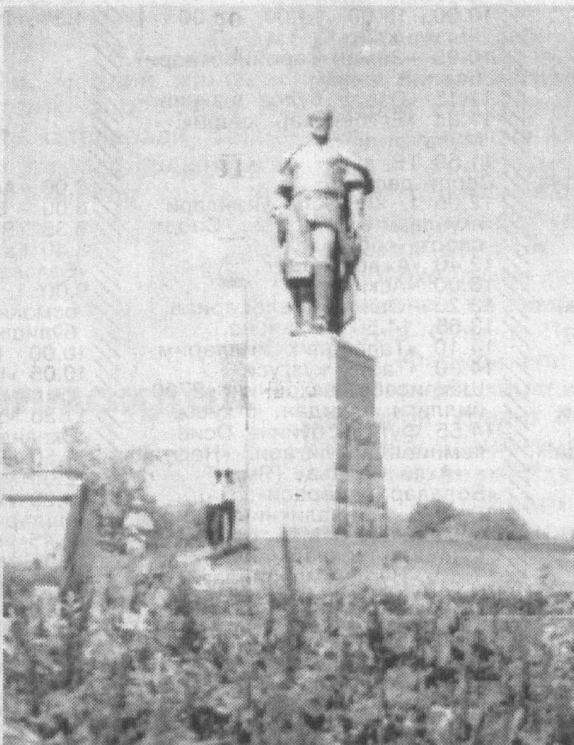
Шахрисабзнинг 2700 йиллигига

Равза боғин висолин истар эсанг Бўл оналар оёғин туфроғи.