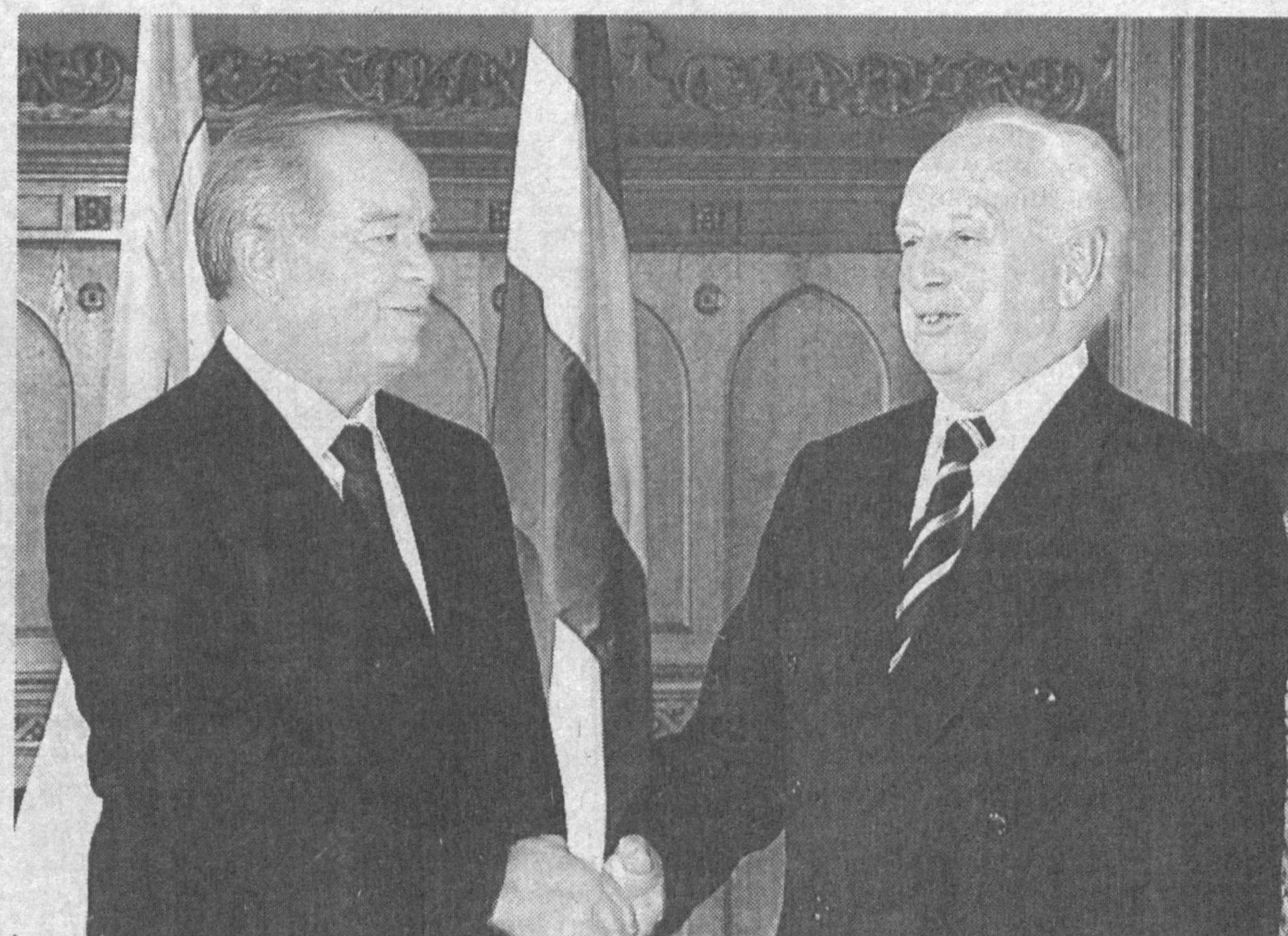
Москвада террорчиликнинг тинч аҳолини қатталари билан террорчилик билан боғлиқ воқеаларга ҳам муносабат билдирди.

Ўзбекистон Республикаси Президенти Ислам Каримов 27 октябр кўни расмий ташриф билан Венгрия республикасига жўнаб кетди.