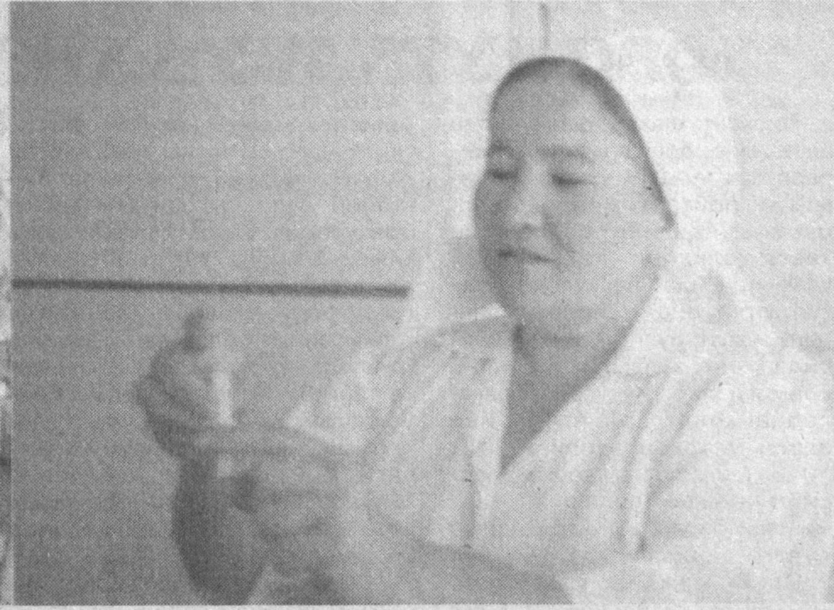
Косон ёғ-экстракция очик ҳиссадорлик жамияти қошидаги профилакторийда аҳолига намунали тиббий хизмат кўрсатиб келинмоқда.