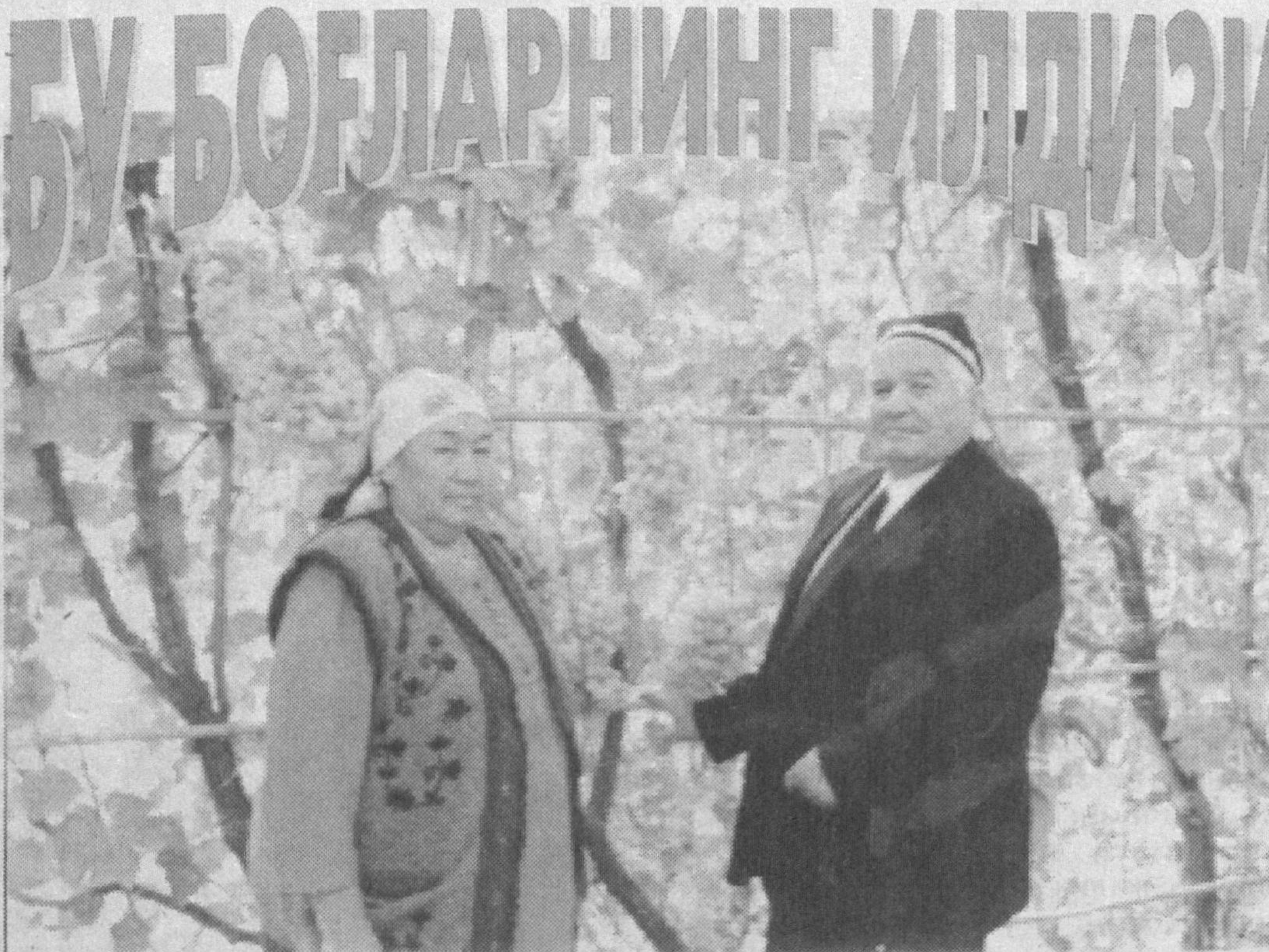
БУ БОҒЛАРНИНГ ИЛДИЗИ

Дарҳақиқат, бу ерда меҳнатқашлар ижтимоий ҳимоясига алоҳида ўрин берилган. Жамоа хўжалигида ишлаб, эндиликда пенсияга чиққан кишилар меҳр оғушида. Лозим топилганларга доимий равишда моддий ёрдам уюштирилмоқда. Бунинг учун бир йилда 40 миллион сўм сарфланапти. Энг муҳими, яхши ишлаб, яхши яшаётган, эл дастурхонини тўкин-сочин этаётган тадбиркор асл деҳқонлар янги-янги ташаббусларга кўл уришмоқда. Неъмат РАФИҚОВ, «Ишонч» мухбири.