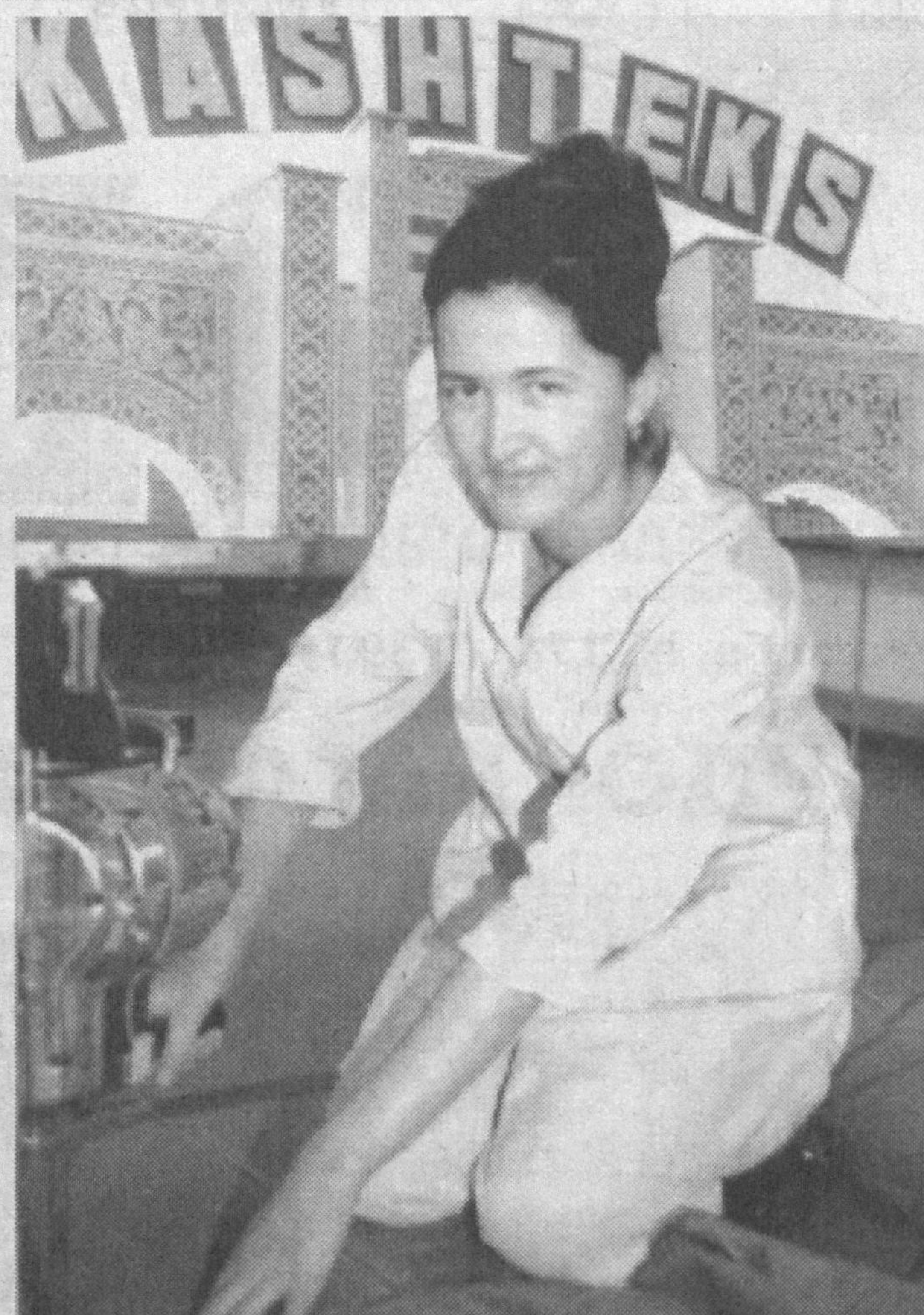
Мехнаткашларга гамхўрлик ўз самарасини бераётир. Ишлаб чиқарилаётган маҳсулотлар сифати ошиб, хари-дорларга маъкул тушмоқда. Шу билан бирга, турли хил эркаклар ва аёллар кийимларининг Германия, Италия, Белорус каби хорижий давлатларга экспорт қилинаётганлиги жамият салоҳиятини оширмоқда.