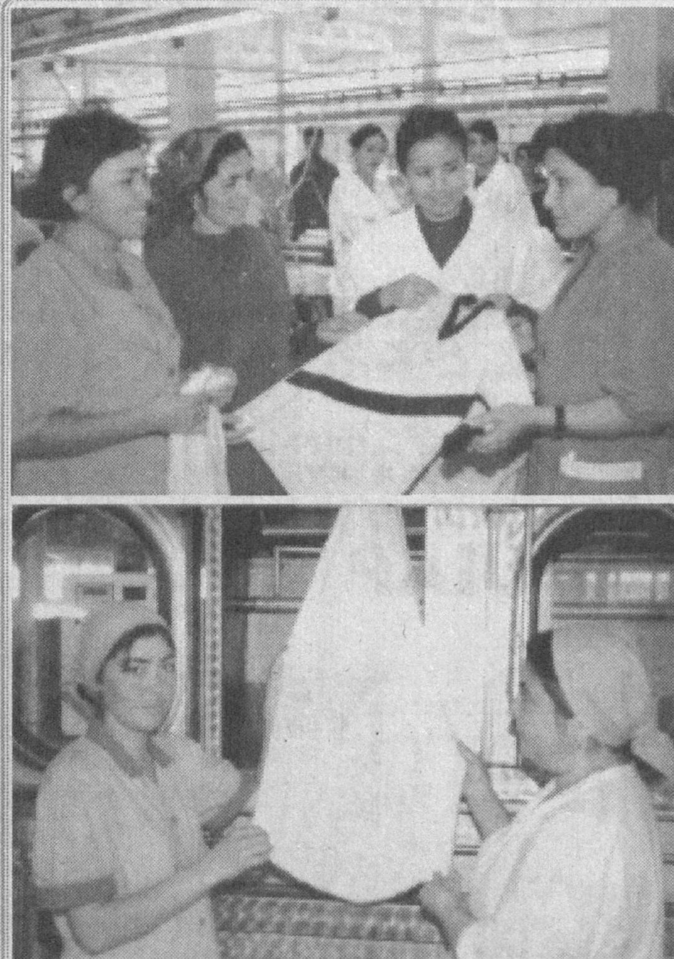
«Каштекс» акционерлик жамиятида 832 нафар ишчи хизмат қилади. Уларнинг 570 нафарини эса хотин-қизлар ҳирмонга таъдил қилишмоқда. Шу билан бирга, турли хил эркаклар ва аёллар кийимларининг Германия, Италия, Белорус каби хорижий давлатларга экспорт қилинаётганлиги жамият салоҳиятини оширмоқда.