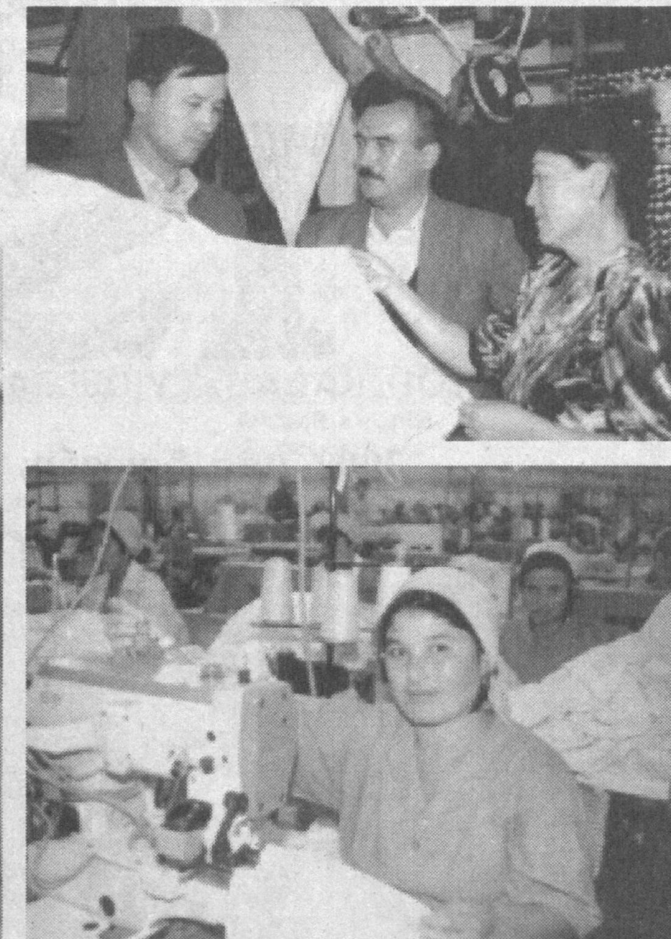
Суратларда: «Каштекс» акционерлик жамияти фаолиятини давомлатиш.