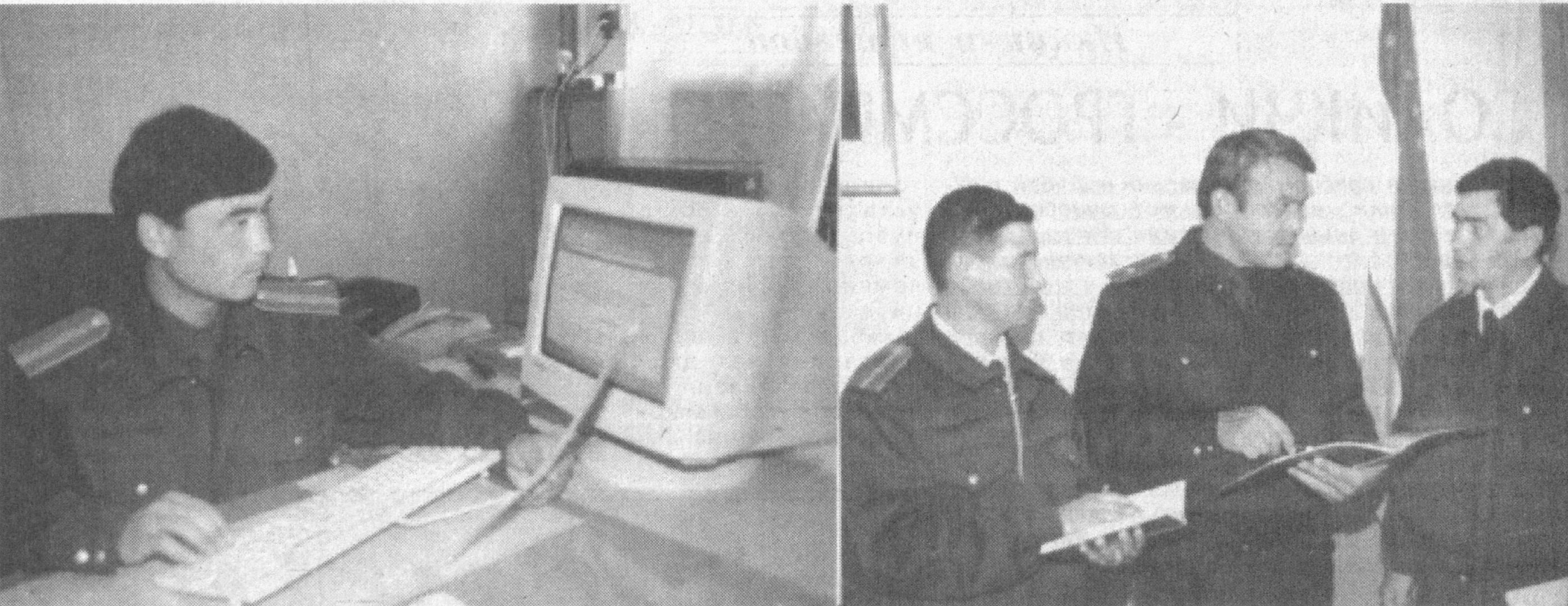
Наманган вилояти Учқўрғон тумани Ички ишлар бўлими томонидан вояга етмаганлар ўртасида жиноятчиликнинг олдини олиш борасида самарали ишлар амалга оширилмоқда. Зеро, туманда йилдан-йилга жиноятлар сони камаймоқда. Бунда ма-

Иш берувчи томонидан ходимларга иш ҳақи сақланмаган ҳолда берилиши шарт бўлган таътиллари кейинги йилга ўтказилишига йўл қўйилмайди. Ходимларга иш ҳақи сақланмаган ҳолда таътил берилганда уларнинг иш жойи сақлаб қолинади.