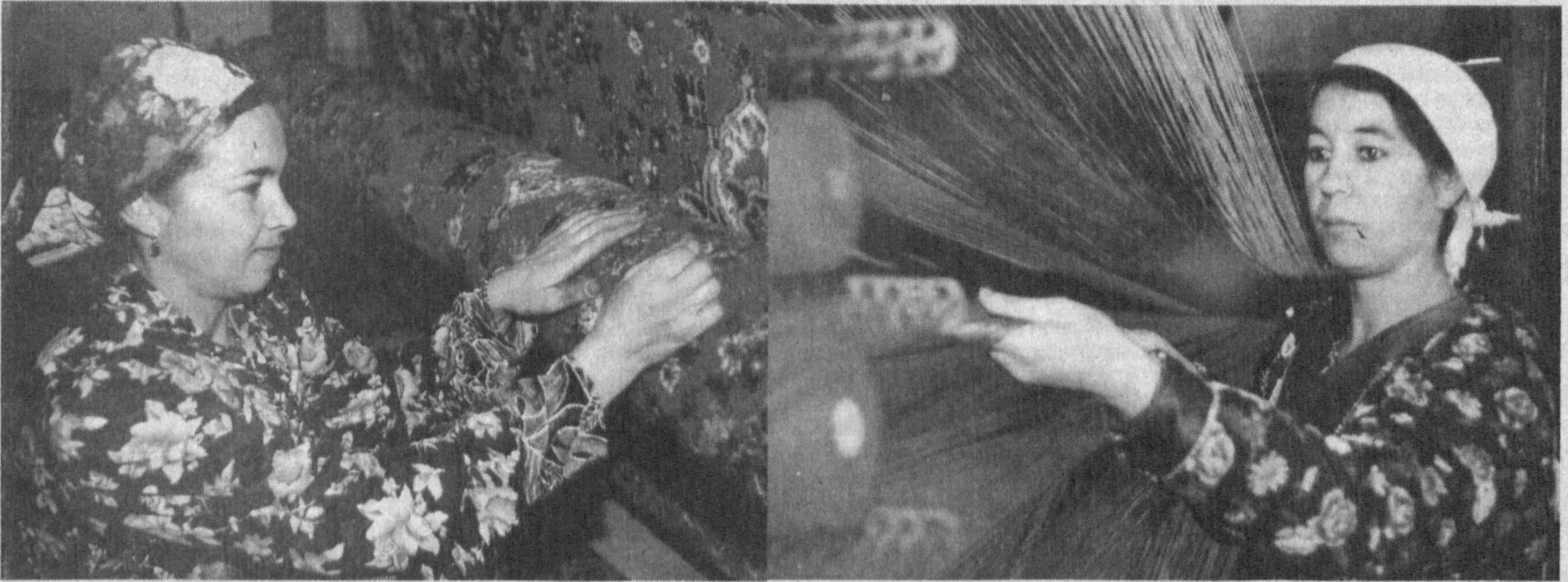
Қўшқўпир туманидаги гилам ишлаб чиқариш хусусий фирмаси 1997 йилдан бери фалият кўрсатиб келади. Бу ерда омилқор, бозор талабини яхши биладиган ишчилар фаолият юритишаётганликлари боис, улар томонидан тайёрланаётган маҳсулотлар ўзининг сифатлилиги билан ажралиб туради.