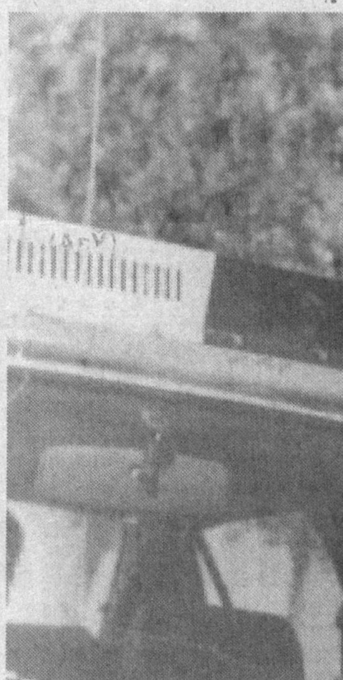
Қашқадарё вилоят ИИБ ЙХХБ катта инспектори, милиция катта лейтенанти Узар Эшўтхатевни Қарши шаҳридаги ҳайдовчиларнинг кўпчилиги яхши танийди. Боиси ўз хизмат вазифасини сийқидидан бажариб, сафдошларига ибрат бўлаётган жон-

тартиби»нинг 31-банди талабларига тўлиқ риоя қилинган ҳолда амалга оширилиши кўрсатиб ўтилган. Демак, ёшга доир ёки III гуруҳ ногирон-лиги тўғрисидаги пенсия олаётган ва ишламай-диган шахслар фақат йилда 2 ой шартнома асосида ишлаб, тўлиқ пенсия олиш ҳуқуқига эга.