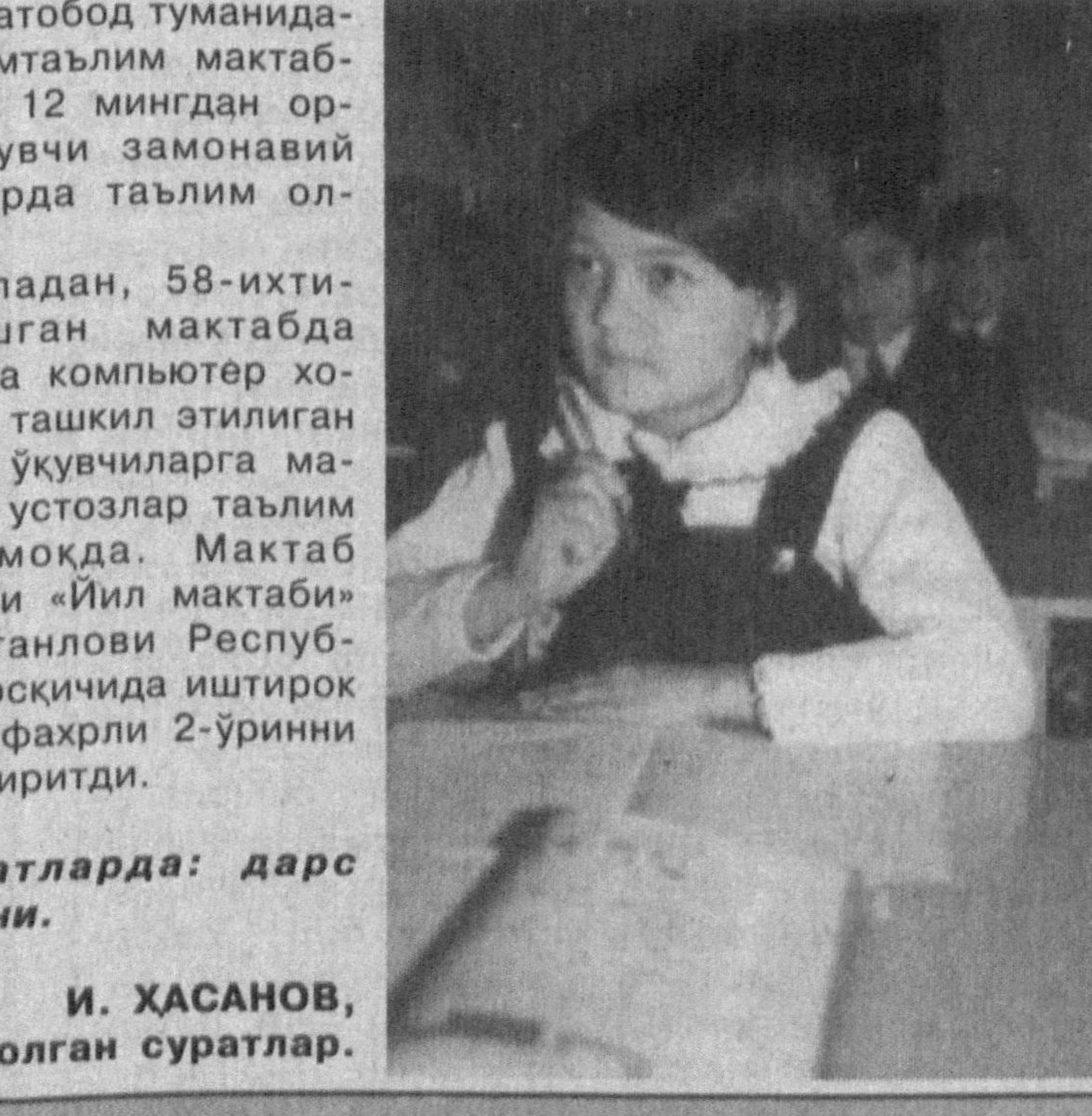
Суратларда: дарс жараёни.