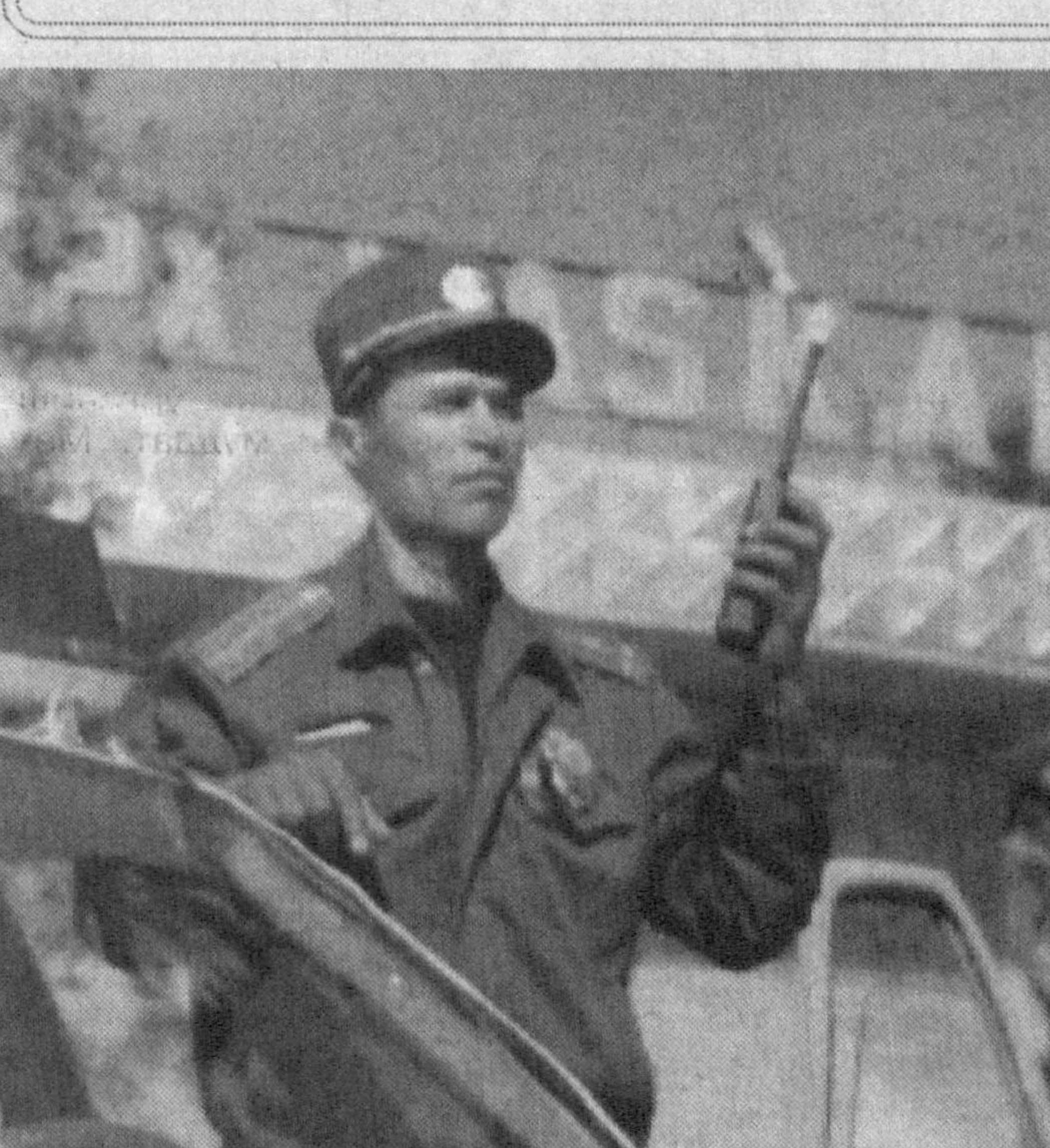
Ана шундай фидойи меҳнат соҳиблари кўпчилигини ташкил этганлиги тўғрисида вилоятда йўл транспорт ҳодисалари ка-майиб бормоқда.

Агар умумий касаллик сабабли ногиронлик пенсияси тайинланган бўлса, ушбу давр ёшга доир пенсияга чиққанида меҳнат стажига қўшил-майди.