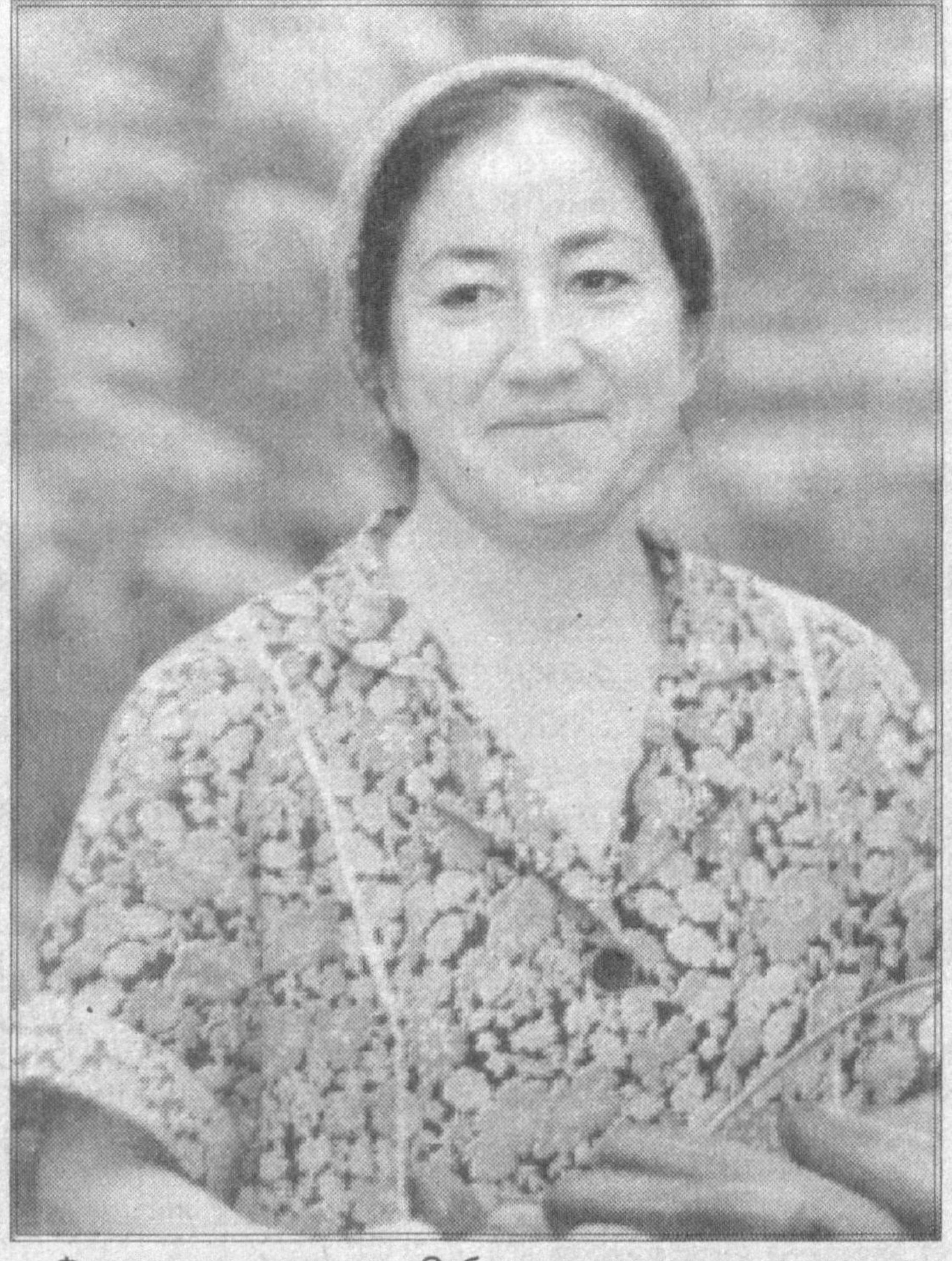
Фаргона шаҳридаги «Сабзавоткор» ҳиссадорлик жамиятининг иссиқхонаси бугунги кунда 6 гектарни ташкил этади. Исроил технологиясининг томчилатиб суғориш усули жорий қилинганлиги боис жамоада самарадорлик ва тежамкорликка эришилмоқда. Ҳозиргача бу ерда 484 тонна помидор ва бодринг етиштирилгани ҳам фикримизни тасдиқлаб турибди.

Ўзбекистон Республикаси Президенти И.КАРИМОВ Тошкент шаҳри, 2002 йил 16 декабр