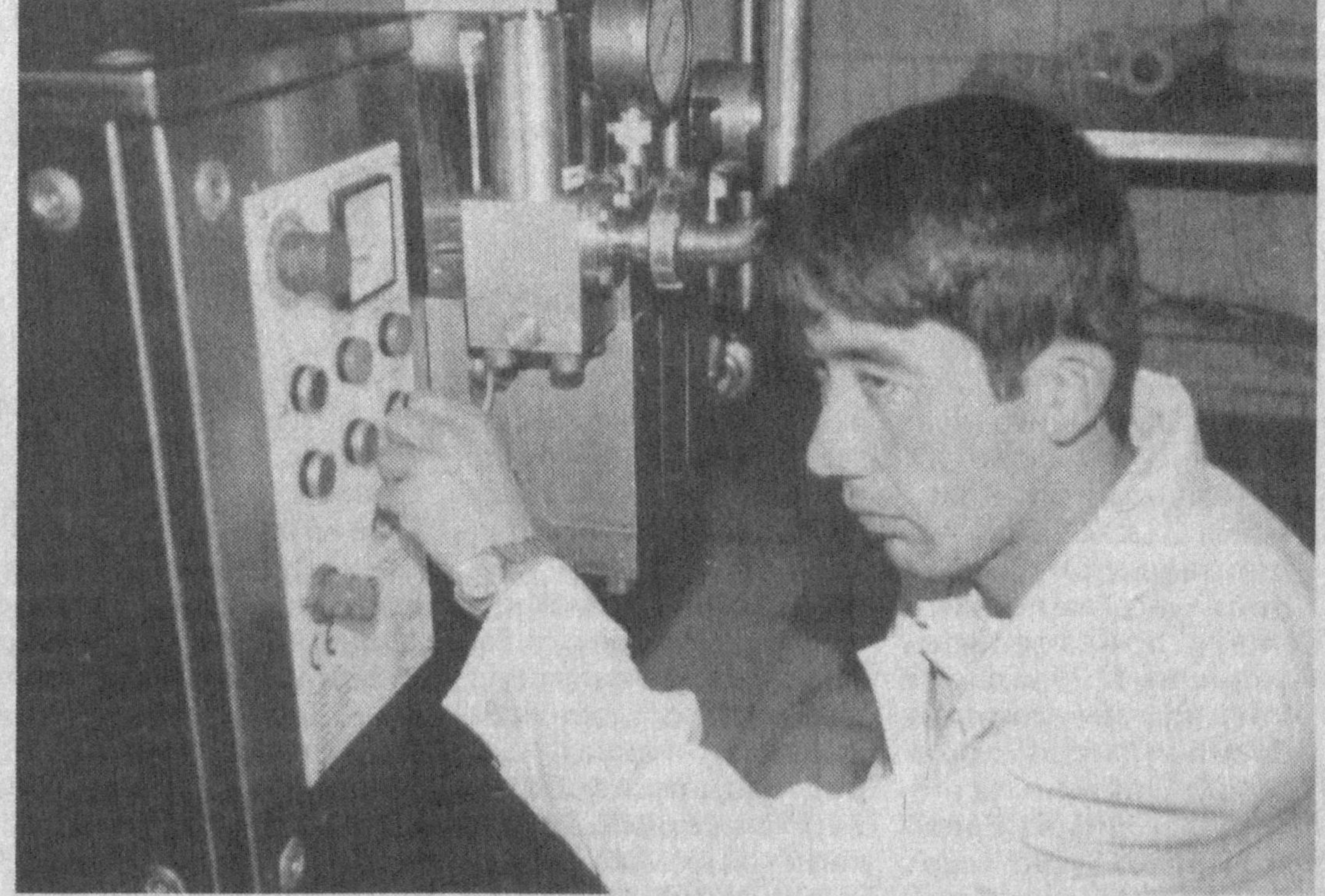
Кўшкўпир туманидаги «Сардор» шўба корхонасида бир кунда икки тонна сут қайта ишланиб, тайёр маҳсулотлар тумандаги мактаб, болалар боғчалари ва аҳолига етказиб берилмоқда. Корхона Италия технологияси билан тўлиқ таъминланганлиги сифатли ва тотли маҳсулотлар тайёрлашда муҳим рол ўйнапти.