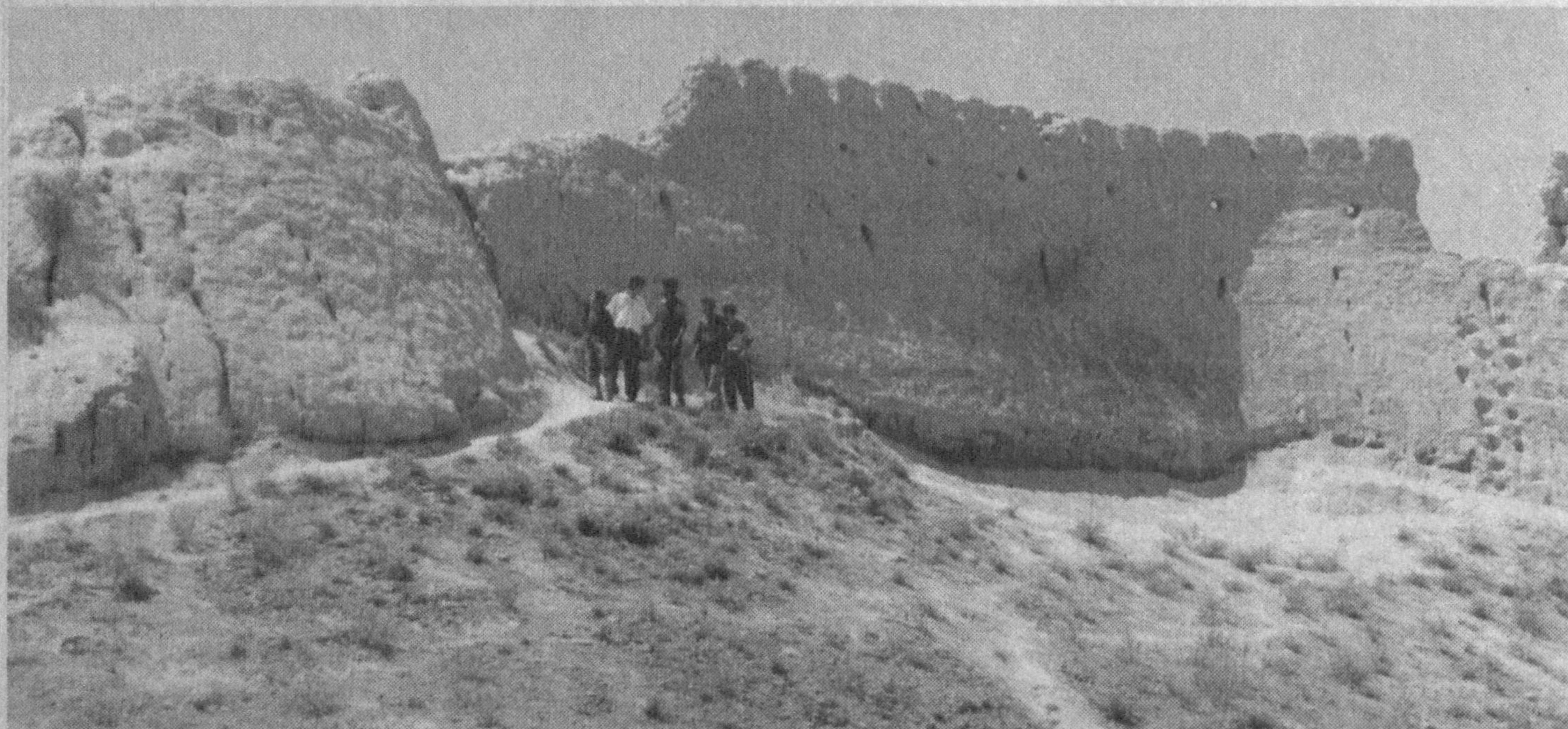
Тарихингдир минг асрлар ичра пинхон, ўзбегим!