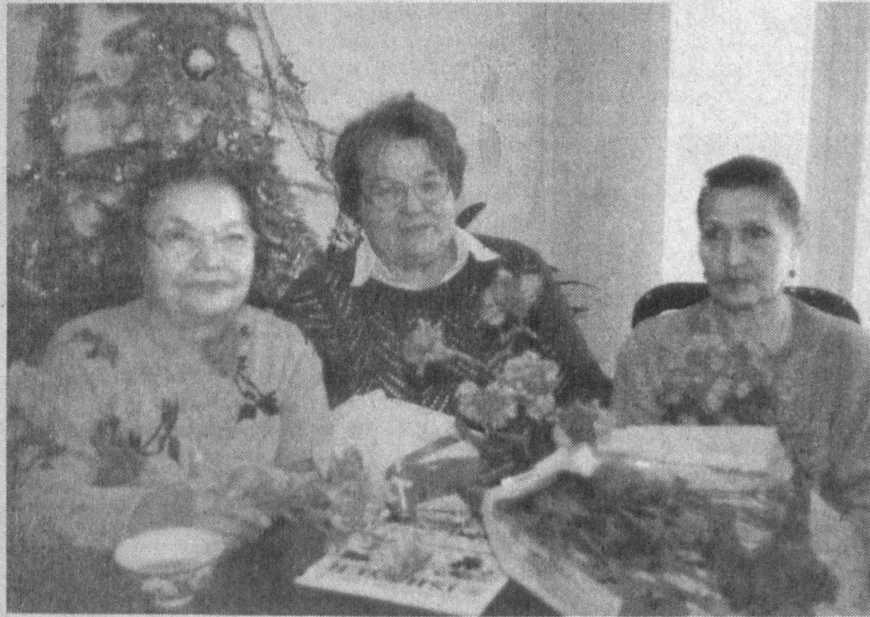
Ўзбекистон енгил, мебел саноати ва коммунал-маиший хизмат ходимлари касба уюшма Марказий кўмитаси ташаббуси билан ташкил этилган тадбирга кўп йиллар мобайнида Марказий кўмитада самарали фаолият кўрсатган меҳнат фахрийлари тақдир этилди. Кўпни кўрган кекса авлод вакиллари ўз иш тажрибалари билан ўртоқлашдилар. Учрашув сўнггида фахрийларга совға-саломлар топширилди.