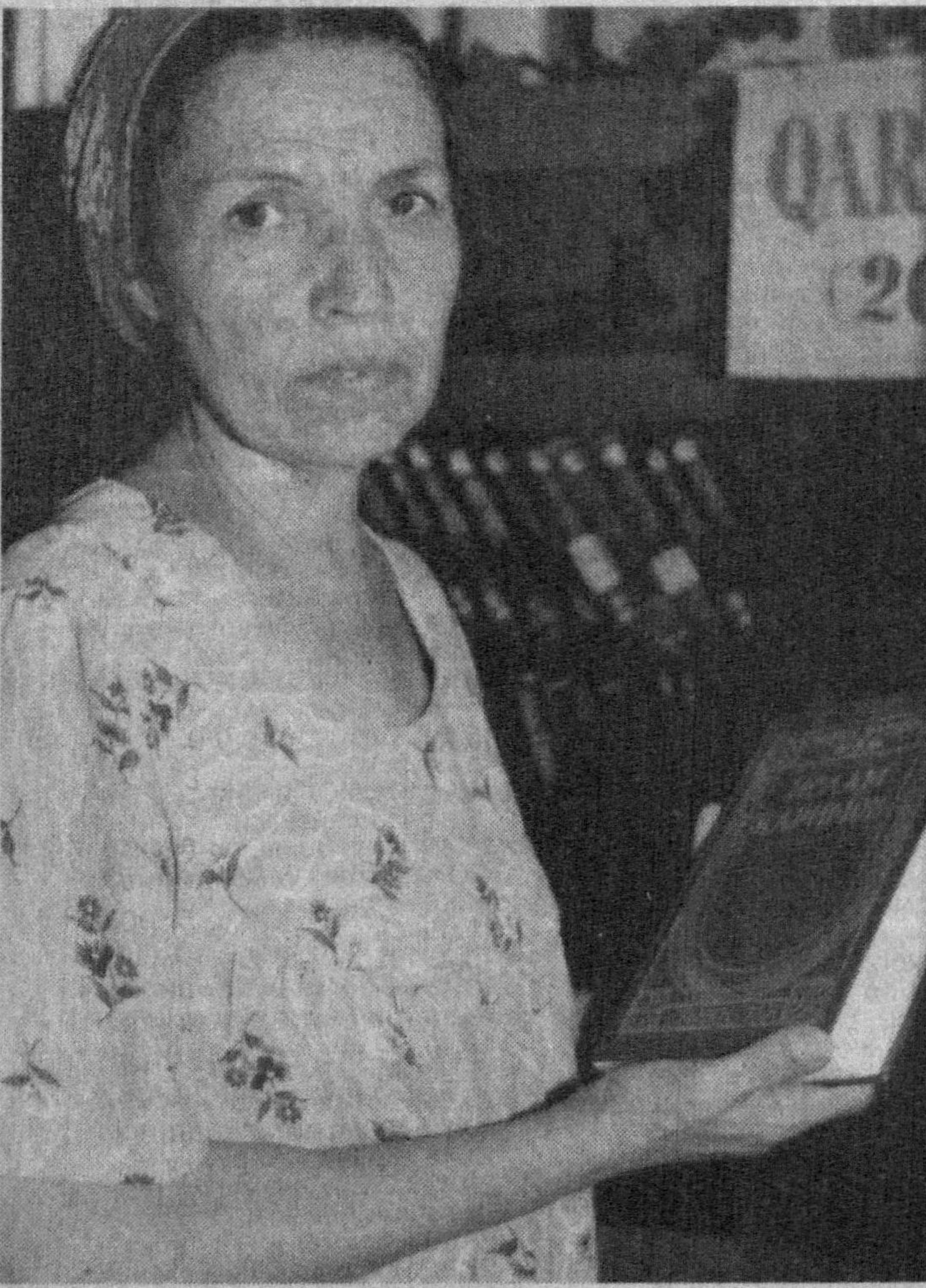
Жизза вилоти Ш.Рашидов номли бирлашган илмий-универсал кутубхонада 120 мингта китоб бўлиб, 3 мингдан ортик китобхонага хизмат қилади.