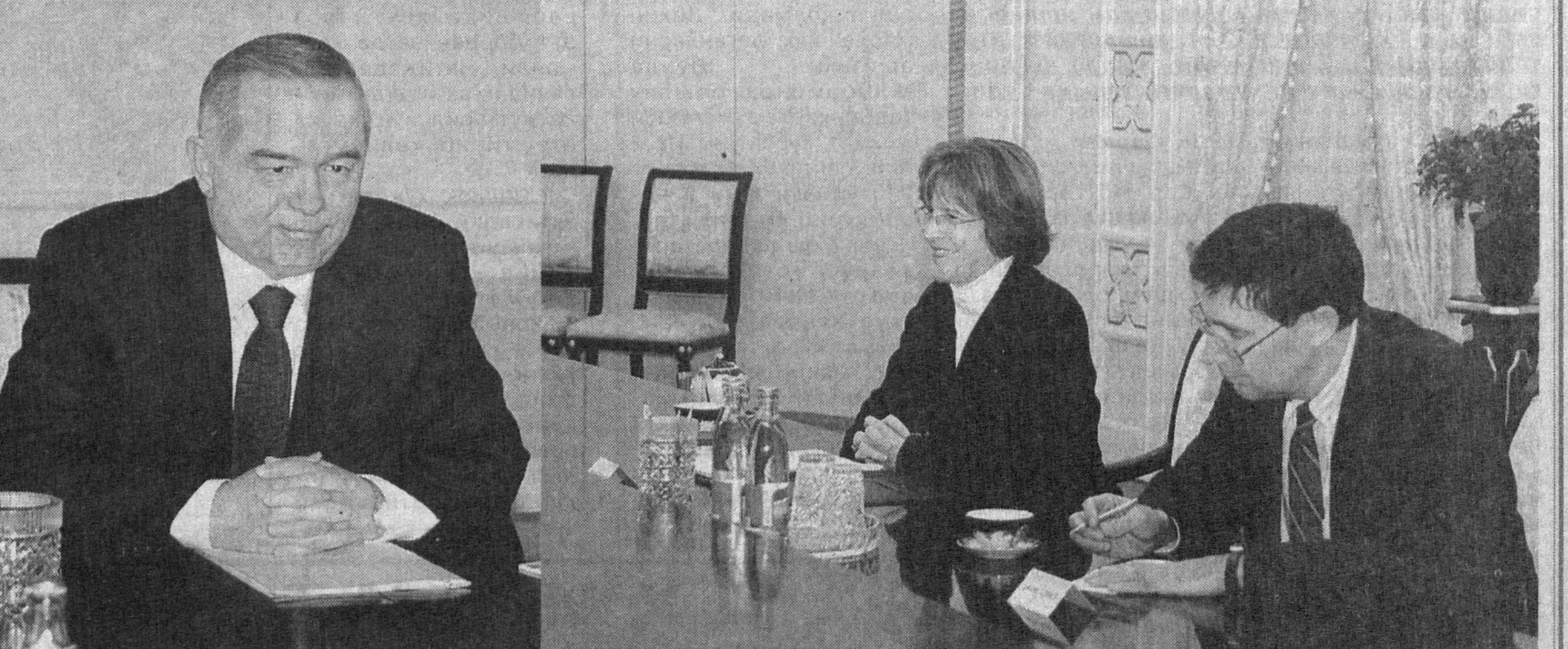
Ўзбекистон Республикаси Президенти Ислам Каримов 24 январь кўни Оқсаройда АҚШ давлат котибининг Европа ва Евроосиё ишлари бўйича ўринбосари Элизабет Жонсни қабул қилди.

Биз Ўзбекистон билан АҚШ ўртасидаги муносабатларни юксак кадрларимиз, - деди мамлакатимиз раҳбари. - Бунга асосли сабаблар бор. Ўзбекистон билан АҚШ ўртасида деярли барча соҳада ҳамкорлик ривожланиб бормоқда. Таъкидлаш жоизки, икки томонлама самарали ҳам-