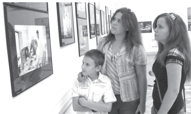
А главное, участникам экспозиции удалось показать счастливую мирную жизнь нашего народа и его благополучие.

В произведениях фотографов — современный Узбекистан. На снимках запечатлены многие яркие события, произошедшие в стране в годы независимости, достижения, сизидательный труд сельчан и горожан, который преобразил нашу республику во всех сферах жизни.