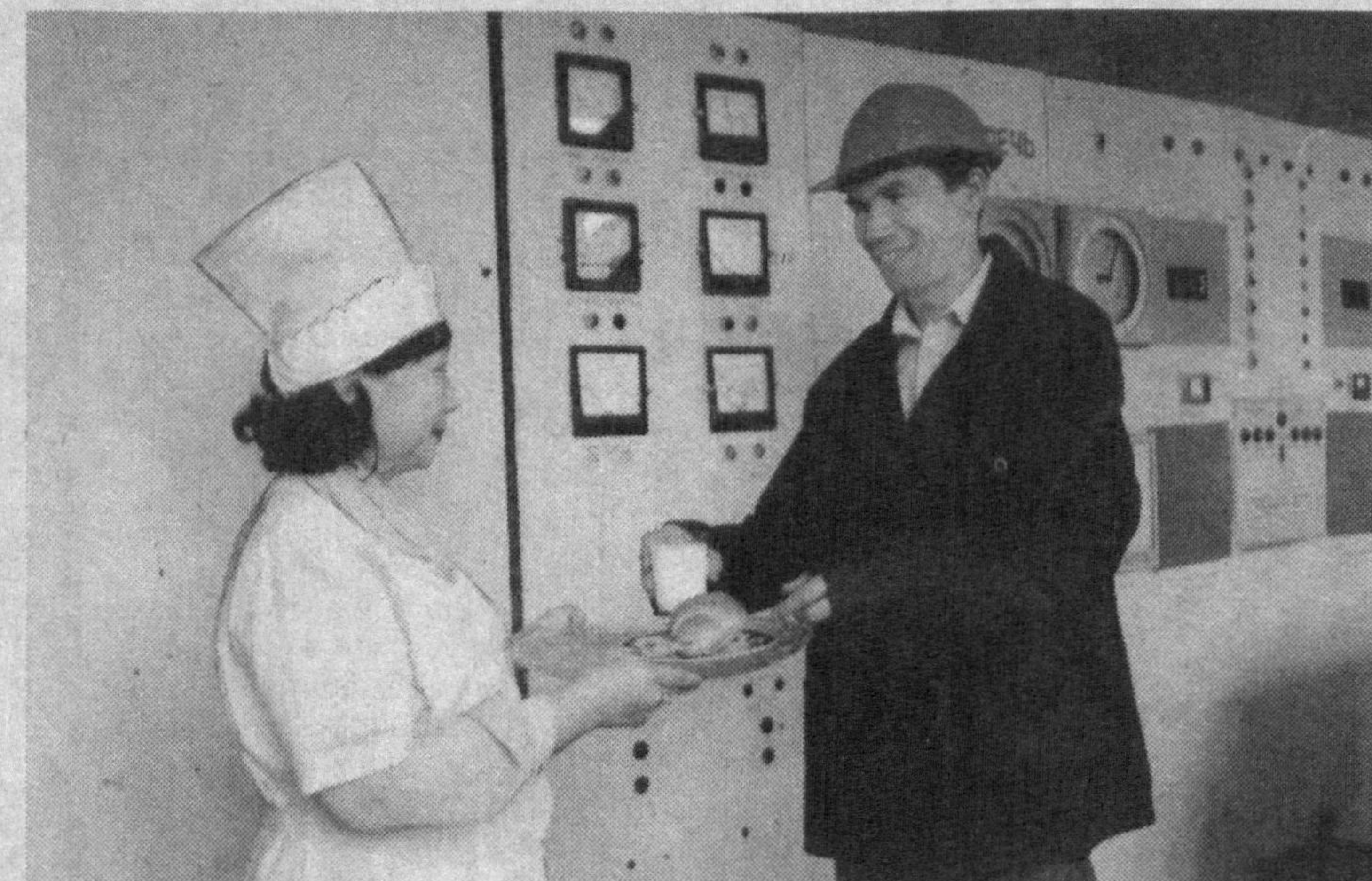
хайратланмади. Тотли неъматлардан ишчиларимиз консерваларга тайёрлашади. Байрамларда улар дастурхонимизни безамоқда.