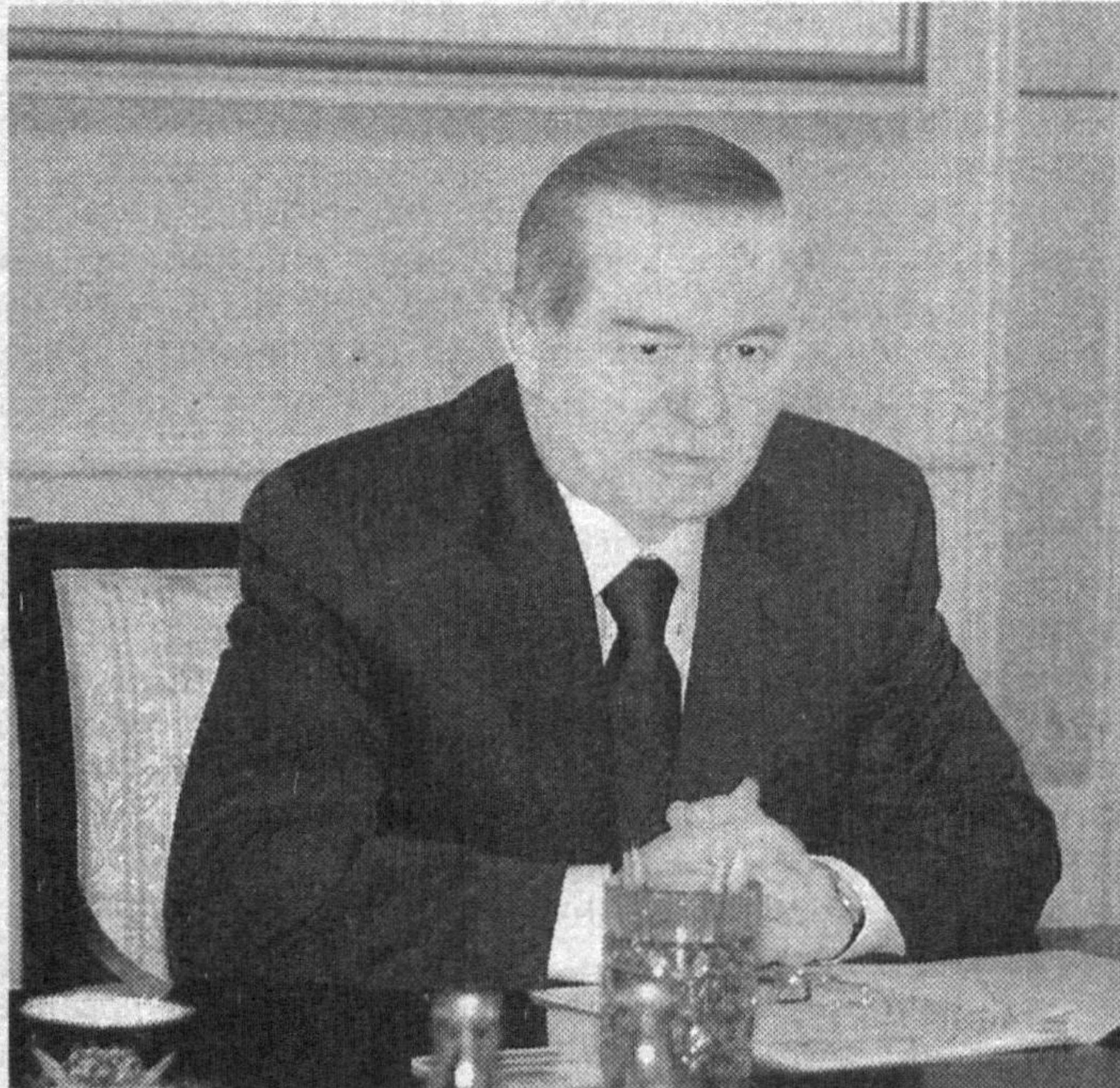
Ўзбекистон Республикаси Президенти Ислом Каримов 5 июн куни Оқсаройда Иқтисодий ҳамкорлик бўйича Япония-Ўзбекистон қўмитаси раиси, «Мицубиси» компанияси бошқаруви раиси Нобуо Охашини раҳбарлигидаги делегацияни қабул қилди.