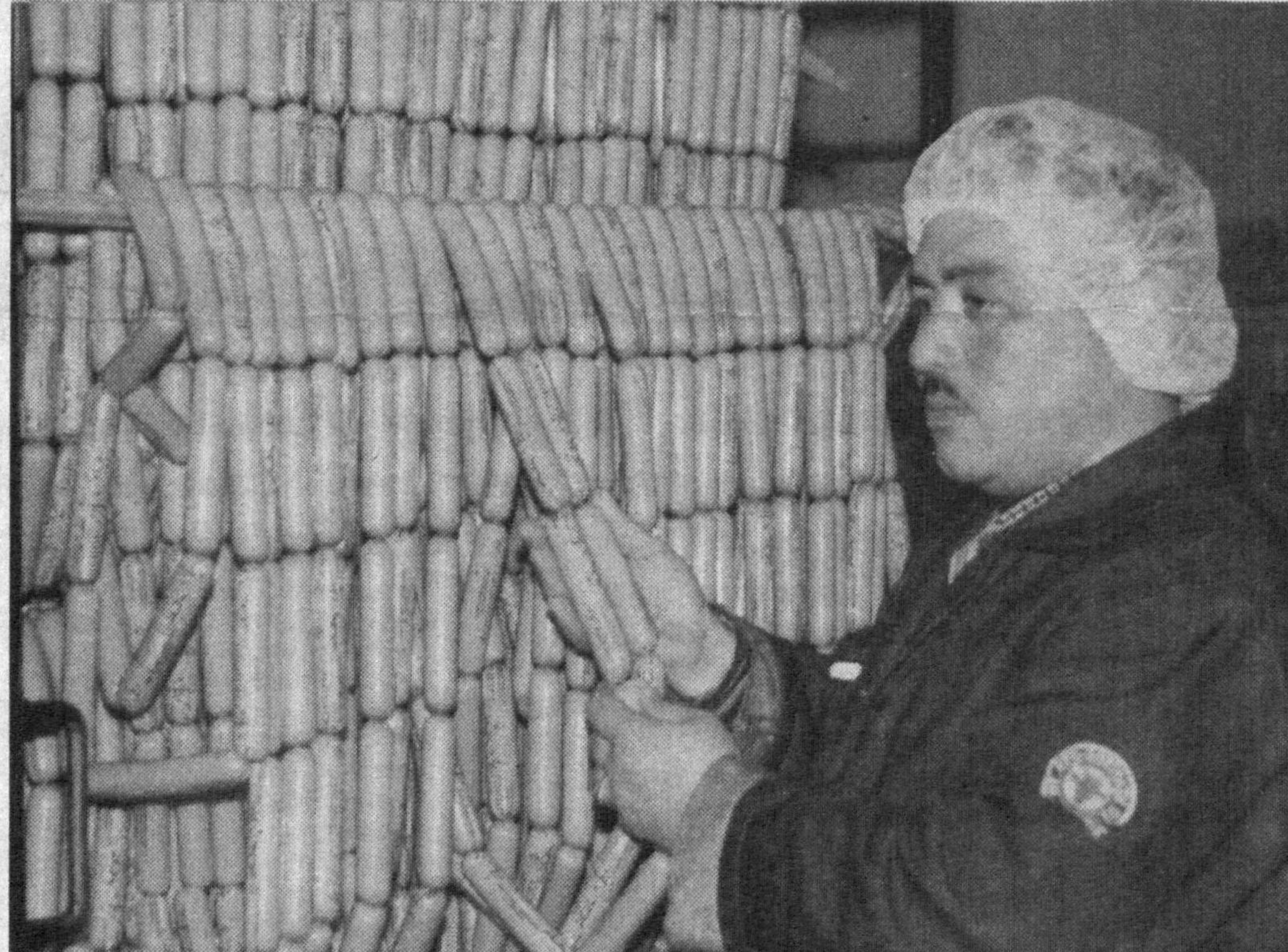
Тошкент туманидаги «Тўхтаниёз ота» фермер хўжалигига қарашли цехда ишлаб чиқарилаётган колбаса маҳсулотлари ўз сифати билан истеъмолчилар эътиборини қозонди. Ҳозирда хориж технологияси асосида бир сменада бир тоннадан ортиқ 10 турдаги маҳсулотлар сотувга чиқарилмоқда. Ушбу цехда 30 нафар ишчи-ҳодим меҳнат қилади. Уларнинг унумли ишлаб, кўнгилли дам олишлари учун маъмурият томонидан барча шарт-шароитлар яратиб берилган. Суратларда: ишлаб чиқариш жараёнидан лавҳалар.