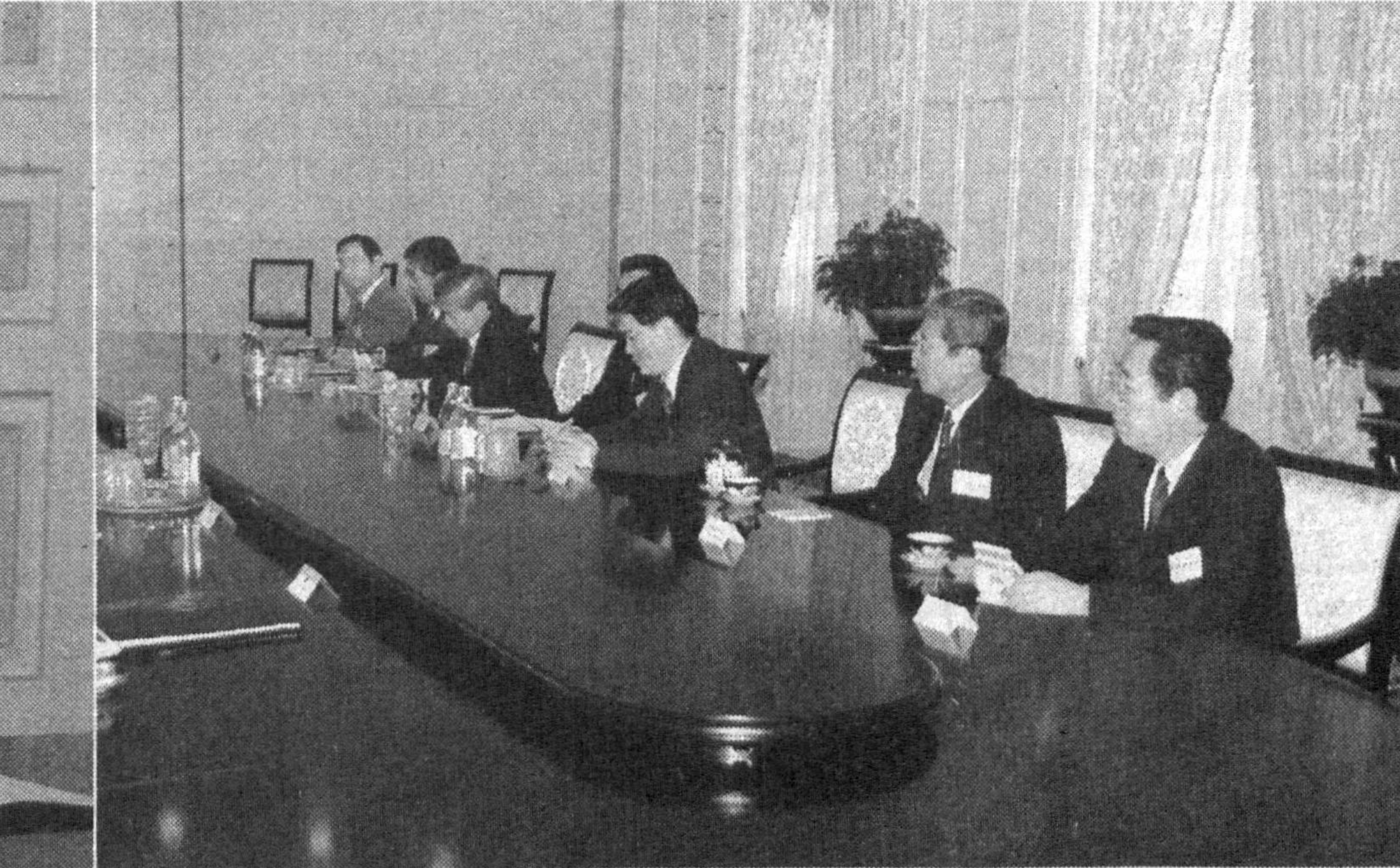
2002 йилнинг июлида ўзаро стратегик ҳамкор эканлигини эълон қилган Ўзбекистон ва Япония икки томонлама муносабатларни

жадаллик ва изчиллик билан ривожлантириб келмоқда. Кўни кеча пойтахтимизда иқтисодий ҳамкорлик бўйича Ўзбекистон-Япония