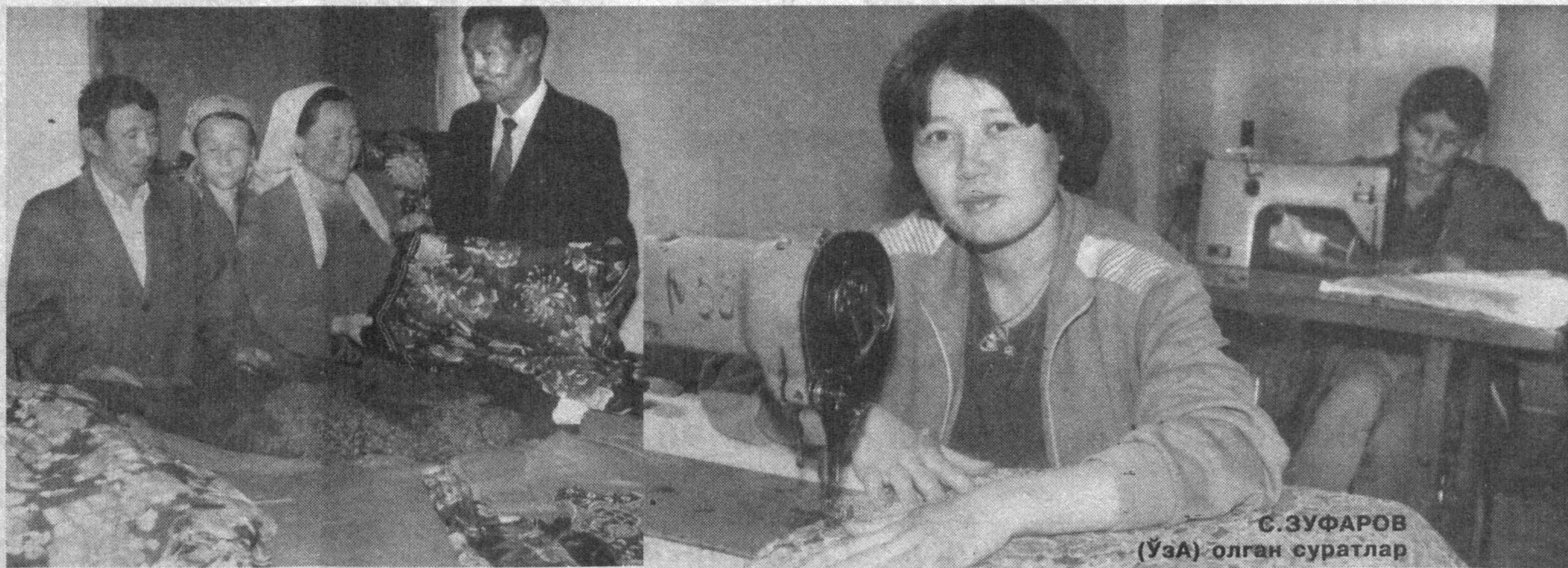
Томди туманидаги «Керегетая» ширкат хўжалиги ҳудудида жойлашган «Симбат» кичик корхонасининг донги нафақат тўли, балки вилоятга ҳам кенг тарқалган. Кичик корхона асосан чўпону-чўликларга турли кийим-бошлар жумладан тўн, кўлка, кўрпа-ёстик ва бошқа турдаги маҳсулотлар ишлаб чиқаради.

Биргина 2002 йилда вилоятда 21082 та янги ишчи ўринлари яратилди. Тадбиркорликни кўллаб-қувватлаш мақсадида ўтган йили 1293,3 миллион сўм кредит ажратилди. Н.БҲРИЕВ