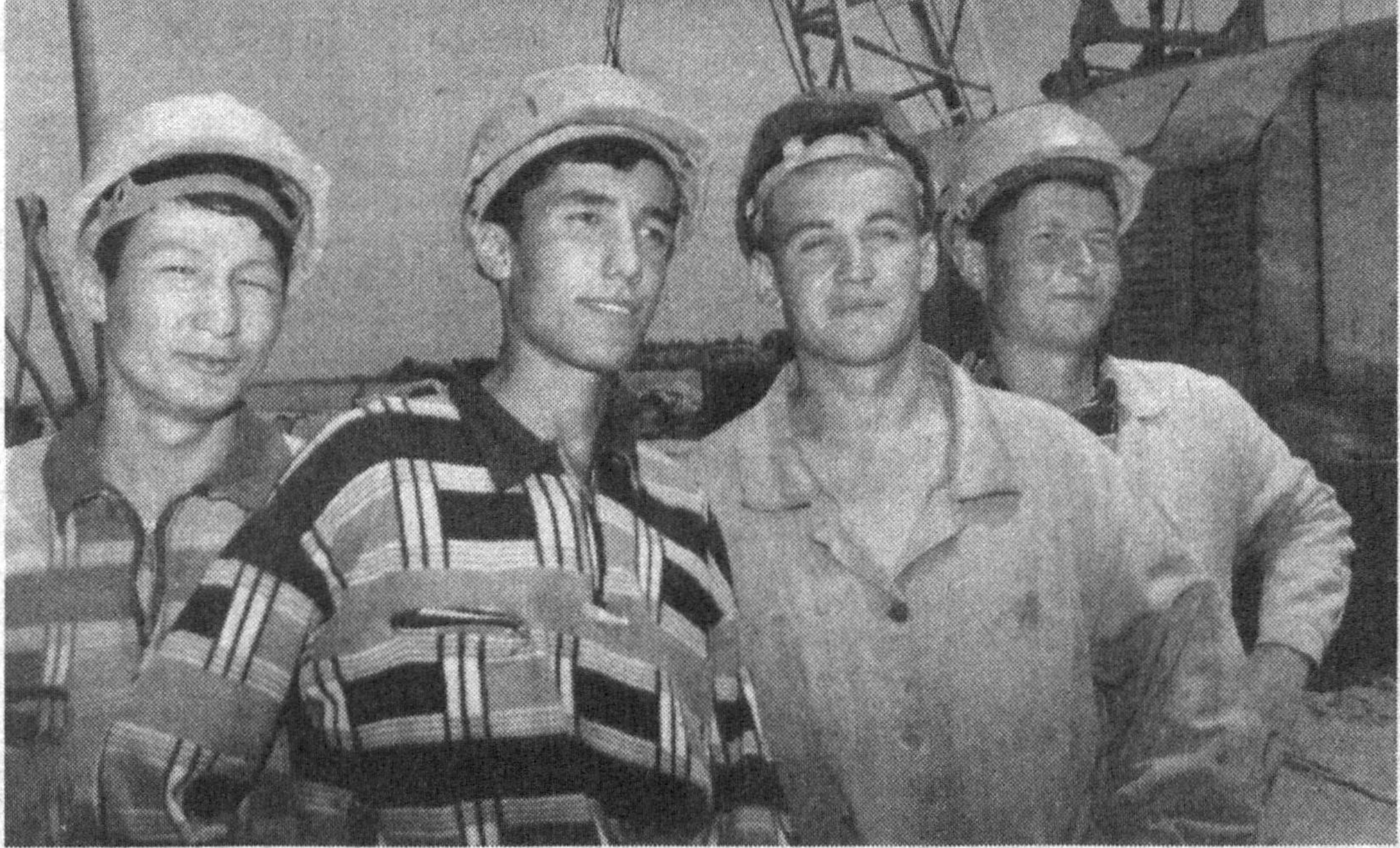
Айни пайтда Амударёнинг қўйи оқими Хоразм вилоятининг Ҳазорасп тумани ва Қорақалпоғистон Республикасининг Тўртқўл туманларини бириктиришчи катта кўприк қурилиши жадал сурьатлар билан олиб борилмоқда. Ҳозиргача бу улкан иншоотнинг бешинчи қисми монтаж қилиниб тугалланди. Қурилишда республикаимизнинг кўприк-қурилиш трестининг барча жамоалари фаол иштирок этмоқдалар.