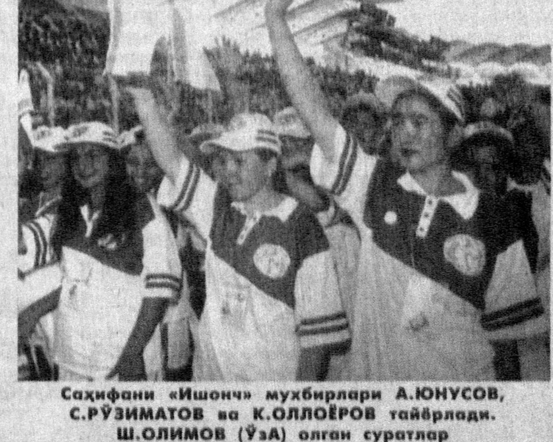
Саҳифани «Ишонч» муҳбирлари А.ЮНУСОВ, С.РУЗИМатов ва К.ОЛЛОЕВОВ тайёрлади.

БАСКЕТБОЛ (Ўғил болалар) Баскетбол баҳслари Андижон алоқа коллежи залларида бўлиб ўтди. Финалда, Андижон - Тошкент шаҳри жамоалари учрашувида мезбонлар устун келди. Учунчи ўрин учун кечган Наманган-Қашқадарё жамоалари баҳсида 59:33 ҳисоби қайд этилди. Финалда Тошкент вилояти ҳамда мезбонлар тўқнаш келган қизлар баҳсида 28:43 ҳисобида андижонликлар галаба қозонди. Кейинги ўринларни Наманган ҳамда Бухоро жамоалари банд этди.