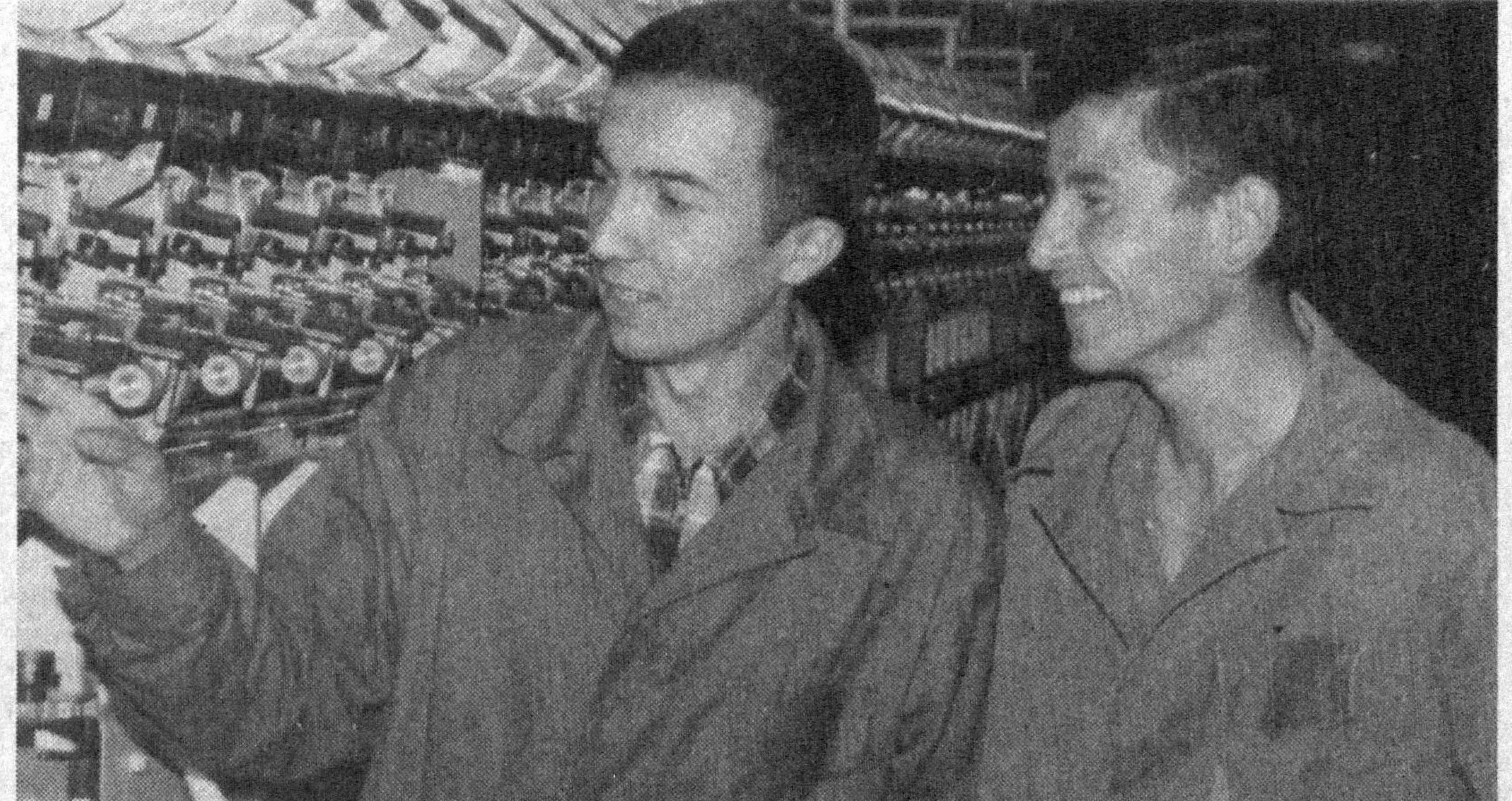
туманида ишга туширилган «Унихо» Ўзбекистон-Германия қўшма корхонаси бунга яққол мисолдир. Унда пахтадан ип-калава тайёрланади. Ҳозиргача бу ерда 400 тонна ип-калава ишлаб чиқарилди. Бу