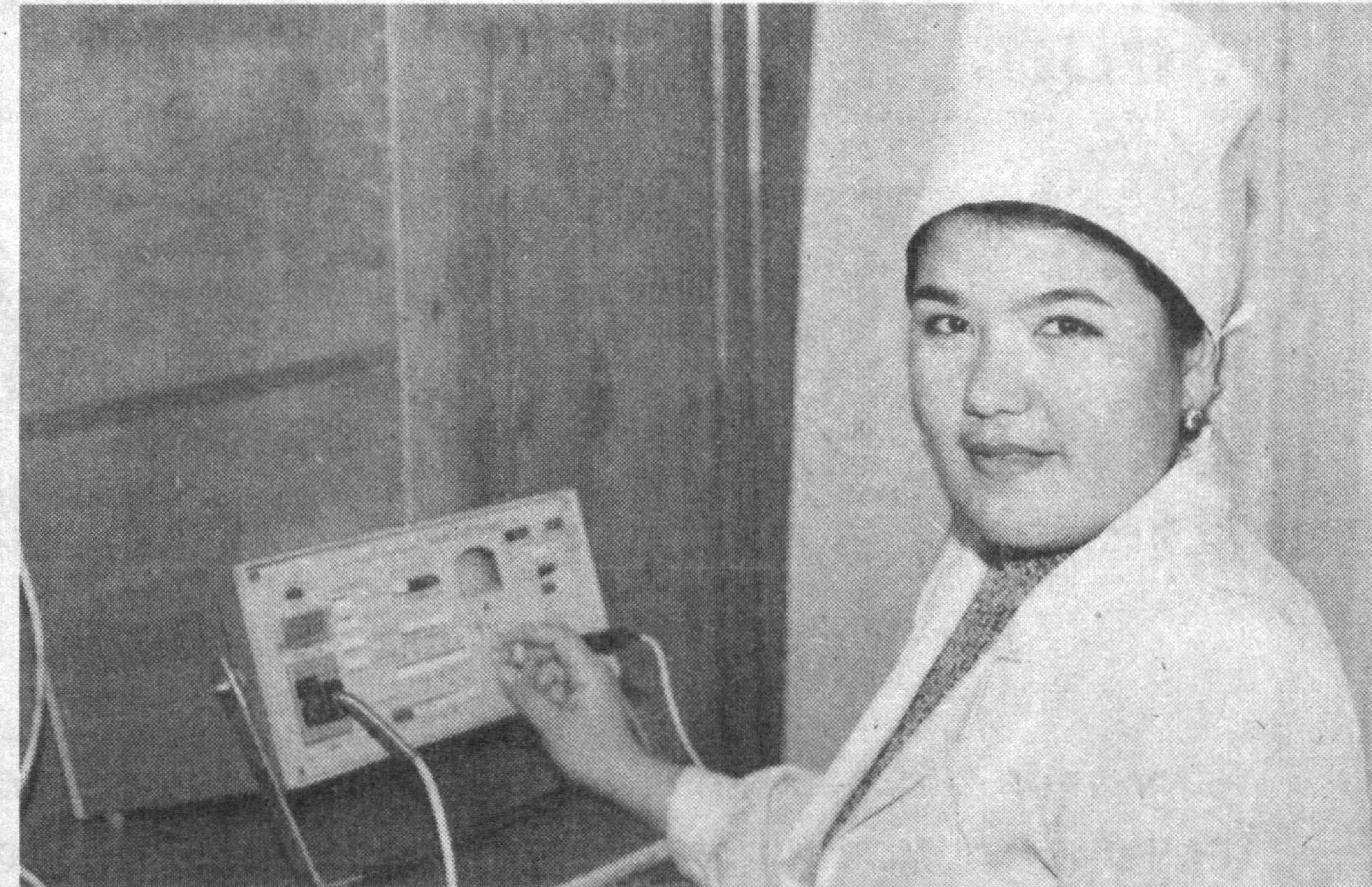
Табобатда маъданли сув билан даволаш кенг қўлланилади. Шу боис, мамлакатимизда фаолият кўрсатаётган шифо масканларида маъданли сув муолажа сифатида фойдаланилади. Мирзачўл туманидаги Гагарин номи санаторийси ҳам бундан мустасно эмас. У ерда чиқаётган маъданли сув таркиби республикамизда ягона ҳисобланади.