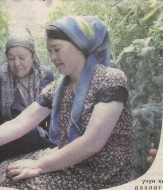
учун ҳам давлатимиз раҳбари тез

Бутун дунё коронавирус пандемиясидан азият чекаётган, озиқ-овқат хавфсизлигини таъминлаш энг глобал муаммо бўлиб турган пайтда уни ҳал этишнинг асосий манбаларидан бири тупроғи зар мамлакатимизда томорқалардан унумли фойдаланилмоқда. Шунинг