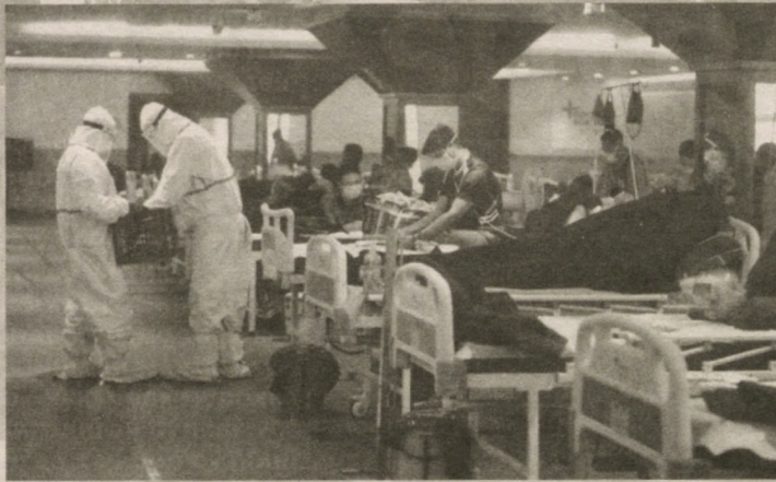
Яқинда ана шундай теҳаслик COVID диссидент коронавирусдан вафот этди. У COVID юқтирган одам томонидан уюштирилган COVID тантана (кечада)да қатнашганидан сўнг коронавирус инфекциясидан вафот этди

Мана ярим йилдан ошдики коронавирус пандемияси дунё бўйлаб авж ола олапти. Энг ривожланган давлатлар ҳам бу пандемиядан азият чекмоқда. Бунга аввало, карантин қоидаларига риоя қилмаслик сабаб бўлмоқда. Карантин қоидаларига нима учун одамлар риоя қилмай кўйди. Тўйлар ўтказилди, бозорларда одамлар масофани сақламай кўйди, ниқобни номига тақди. Нега кўпчилик коронавирус юқишдан қўрқмади. Бунга сабаб баъзиларнинг касалликнинг борлигига шубҳа билан қарашида.