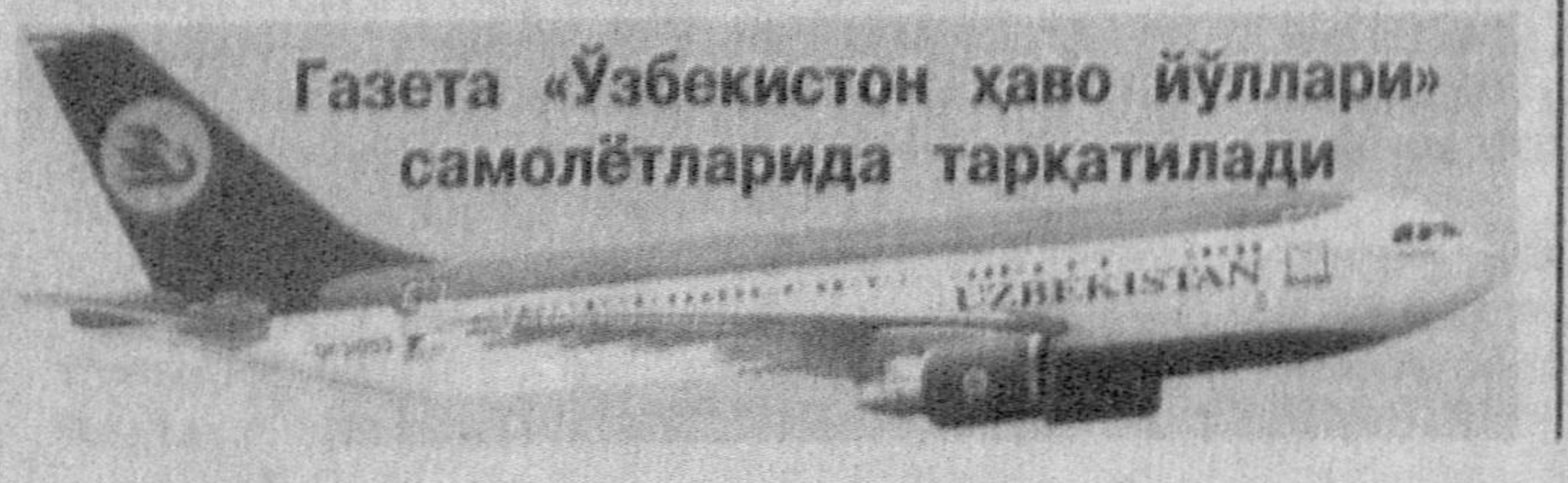
Газета «Ўзбекистон ҳаво йўллари» самолётларида тарқатилади