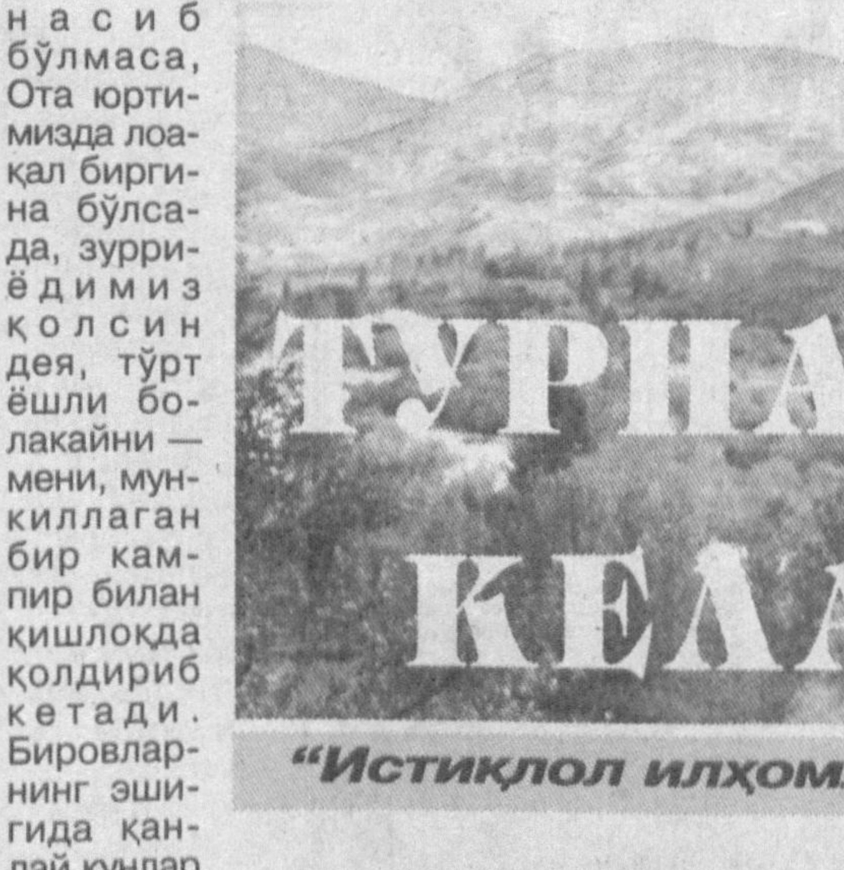
“Истиқлол илҳомлари” туркумидан

Сенда соғинчларим қолиб кетган, Тош. Ёдингдими, ўн еттинчи “Улуғ инқилоб” йилларида ота-онам қариндош-уруғларимиз билан бир қарвон бўлиб Афғонистонга йўл олдидилар. Хали ёш, йўл қийинчиликлариға чидай олмайди, ҳам ким билсин, балки юртга