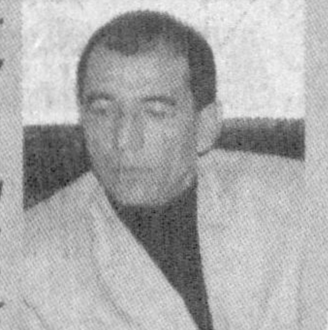
Абдулла ОРИПОВ, Ўзбекистон Қаҳрамони

Ифтихорнинг гўзал шаклу шамойиллари кўп. Уларнинг энг аввали, албатта, халқу Ватанидир! Ундан сўнг, балким, устозу шоғирдлар. Шу маънода, жумладан мен ўзимни ниҳоятда бахтли инсонлардан бири деб ҳисоблайман. Улуғ халқим, буюк устозларим, кўз-кўз қилишга арзигулик софидил шоғирд укаларим бор. Шобён шеърятимизда эса ана шундай ифтихорларимиздан бири, шубҳасиз, Сирожиддин Сайиддир!