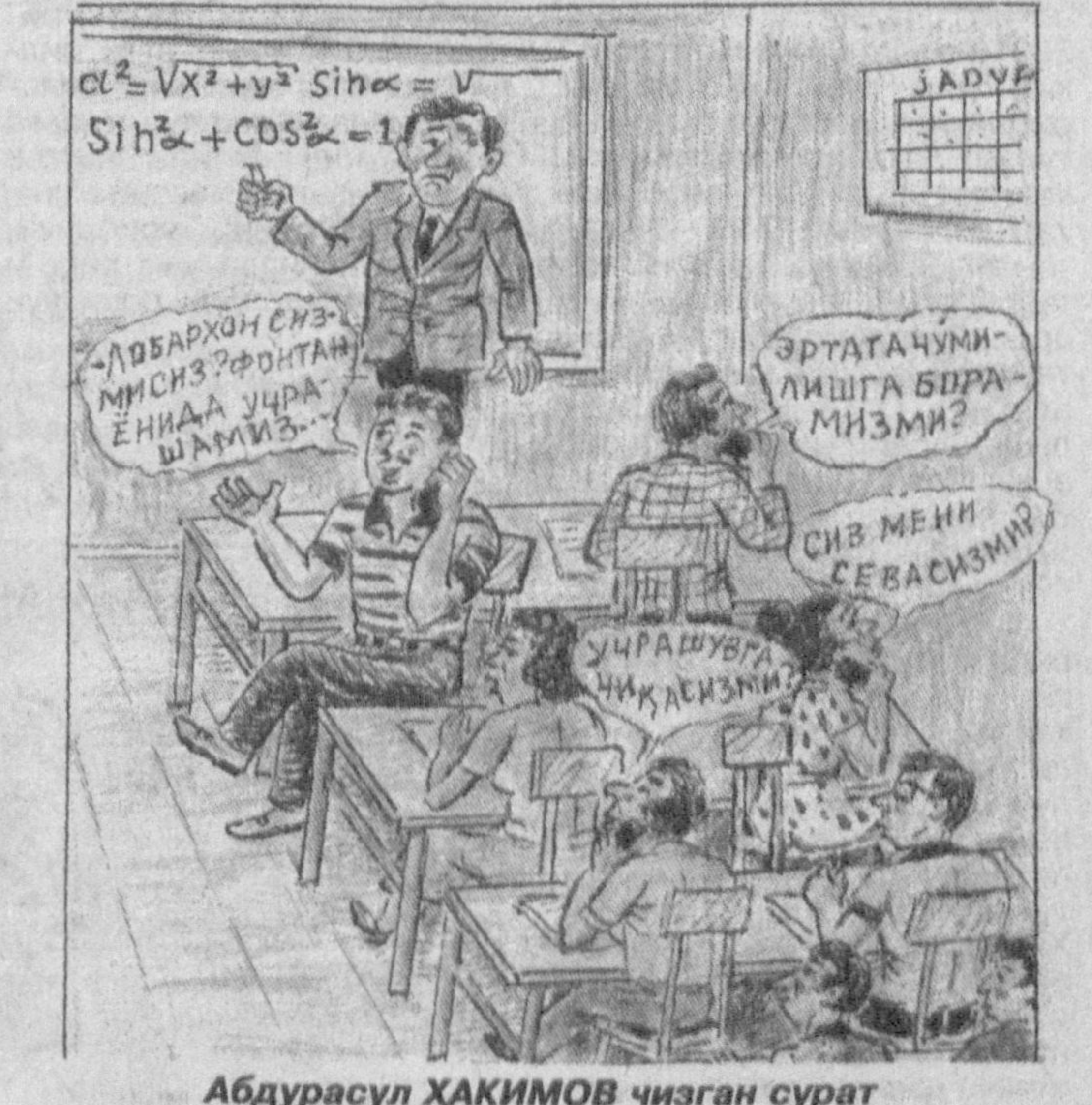
Абдурашул ҲАКИМОВ чизган сурат