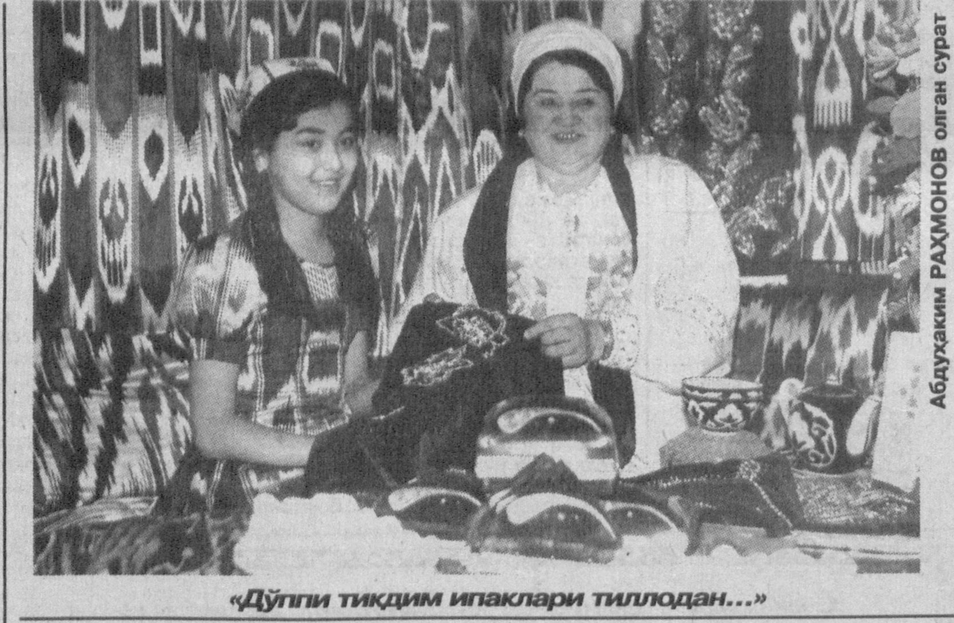
«Дўппи тикдим ипақлари тиллодан...»

Утган асрлардаги маънавий ва мезморий бунёдкорликлардан тортиб шухулқи давринида қўлга киритилаётган улкан ютуқлар ҳақида фахр туйғуси билан ёзган шоир миллият тарихидеги баъзи муҳим ва фожиаги воқеалардан ҳам кўз юзмайди. «Нодира қабри қошида» шеърда у Бухоро амири «Худо урган, Қуръон урган» қотил Насруллога лаянат ёғдириб, фожиаги тарзда қатл этилган буюқ