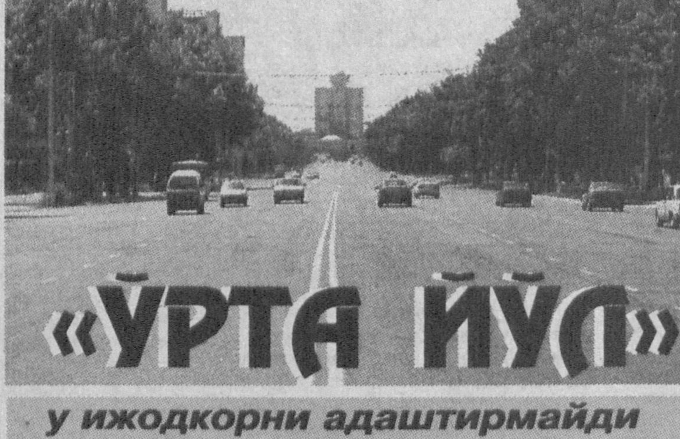
«УРТА ЙЎЛ» у ижодкорни адаштирамайди