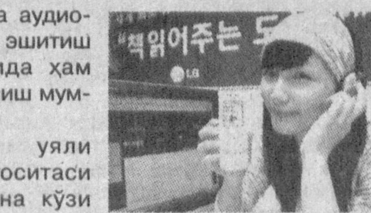
қўшиқ ва аудио-ёзувлар эшитиш мақсадиде ҳам фойдаланиш мумкин. Янги уяли алоқа воситаси фақатгина кўзи ожизларга соти-лади. LF1300 телефони 420 доллар атро-фида баҳоланмоқда.

Жуда ихчам — 16 миллиметр ҳажмли LG LF1300 телефони MP3-плеер ускунасига ҳам ўрнатилган. Яъни аппаратдан бемалол