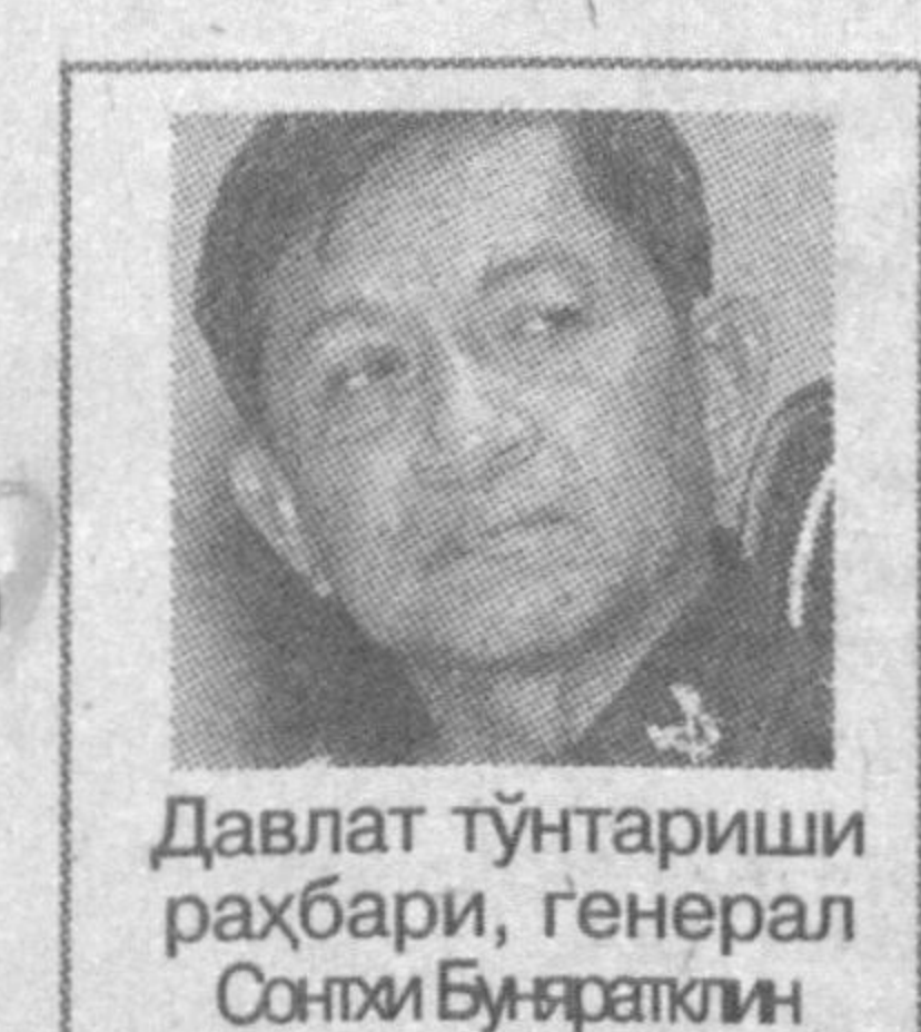
Давлат тўнтарыши раҳбари, генерал Сонтхи Буняратқлин

20 сентябрға ўтар кечаси Таиланд пойтахти Бангкокда ҳарбийлар томонидан давлат тўнтарыши амалга оширилди. Таиланд халқи ислохотлар идораси — Сийсий ислохотлар ўтказиш кенгаши раҳбари, генерал Буняратқлин икки ҳафта ичида янги бош вазир тайинлашни маълум қилди. Ҳарбий кўмондоннинг фикрича, яқин кунларда келадиган янги ҳукумат ҳам узок ишламайди. 2007 йилнинг октябрда бутун мамлакатда ҳукумат ва парламент учун сайлов ўтказилади. Унга қадар эса махсус комиссия мамлакатнинг янги Конституциясини ишлаб чиқади.