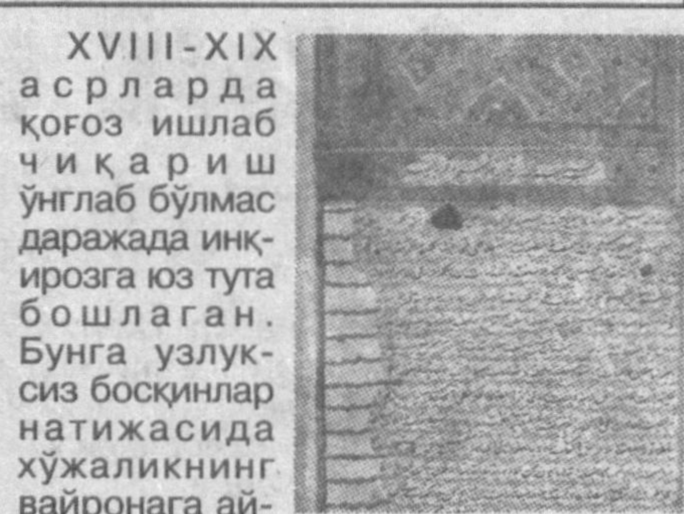
Баҳромжон КАЛОНОВ чизган сурат.