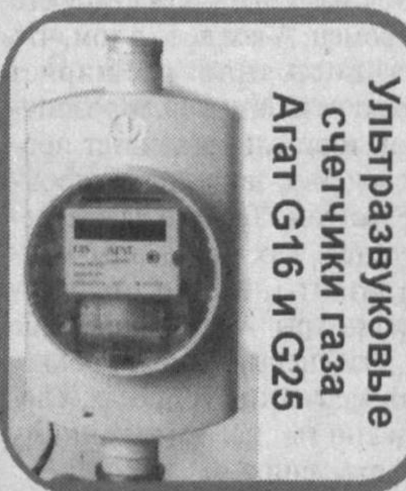
Ультразвуковые счетчики газа Агат G16 и G25

которые являются современными электронными приборами учета газа, произведенными в России.