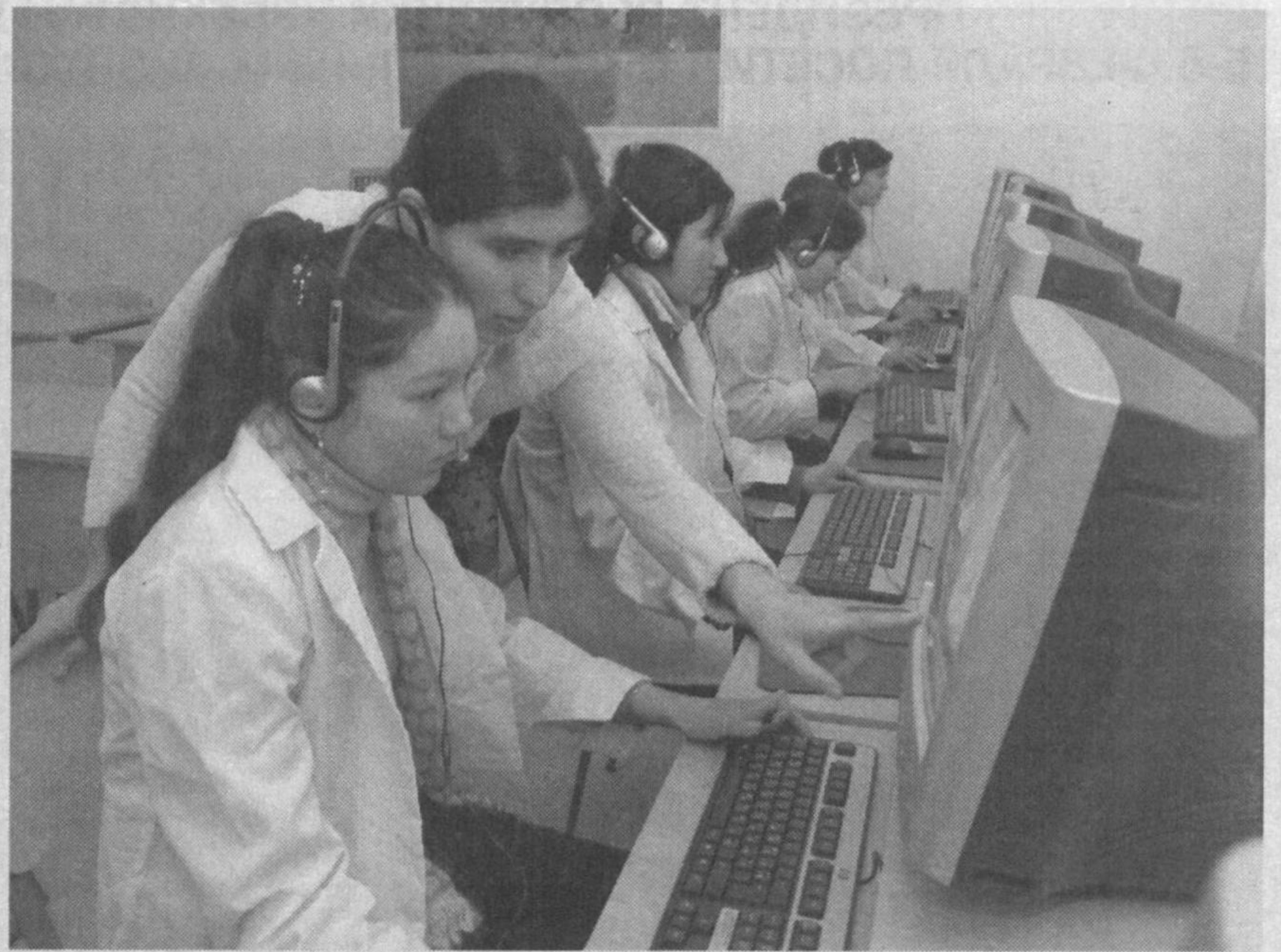
В махалле Полмон города Кувася построена школа на 400 ученических мест.