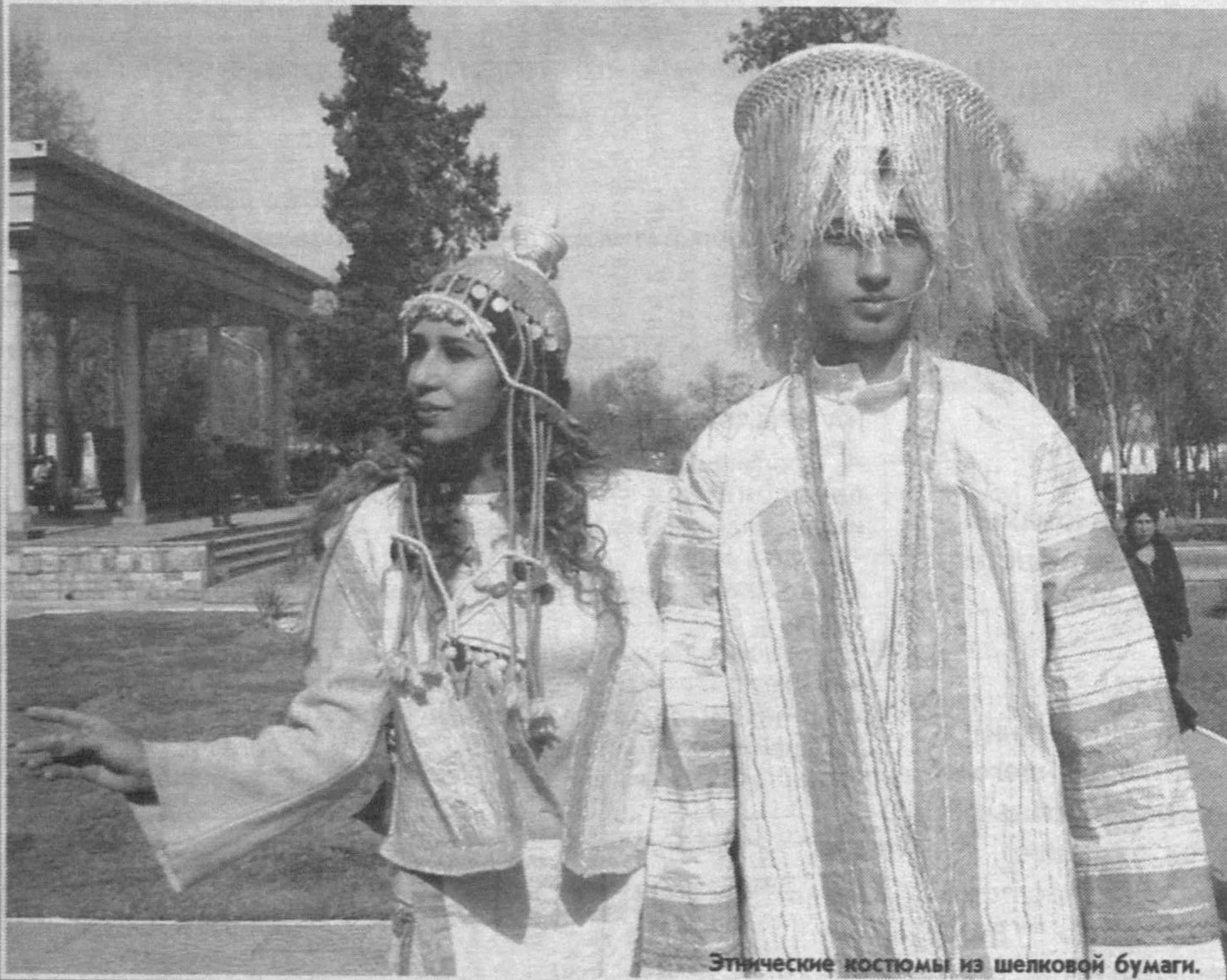
Этнические костюмы из шелковой бумаги.

Камень и кость, кожа и металл, воск и береста, папирус и пергамент - у современных письменных источников было много предшественников. Бумаге человечество обязано настоящей революцией в передаче информации. Ее изготавливали во всем мире, но самаркандские мастера знали особый секрет.