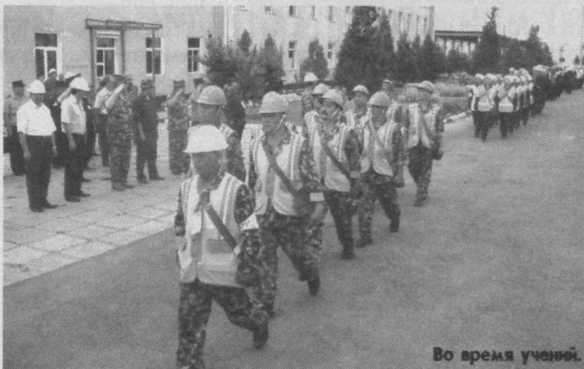
Во время учений.

Ангренский терминал - большой и пожароопасный объект, поэтому особое внимание было уделено готовности противопожарной службы. Отрабатывались действия по локализации и ликвидации очага возгорания на железнодорожной эстакаде. По-