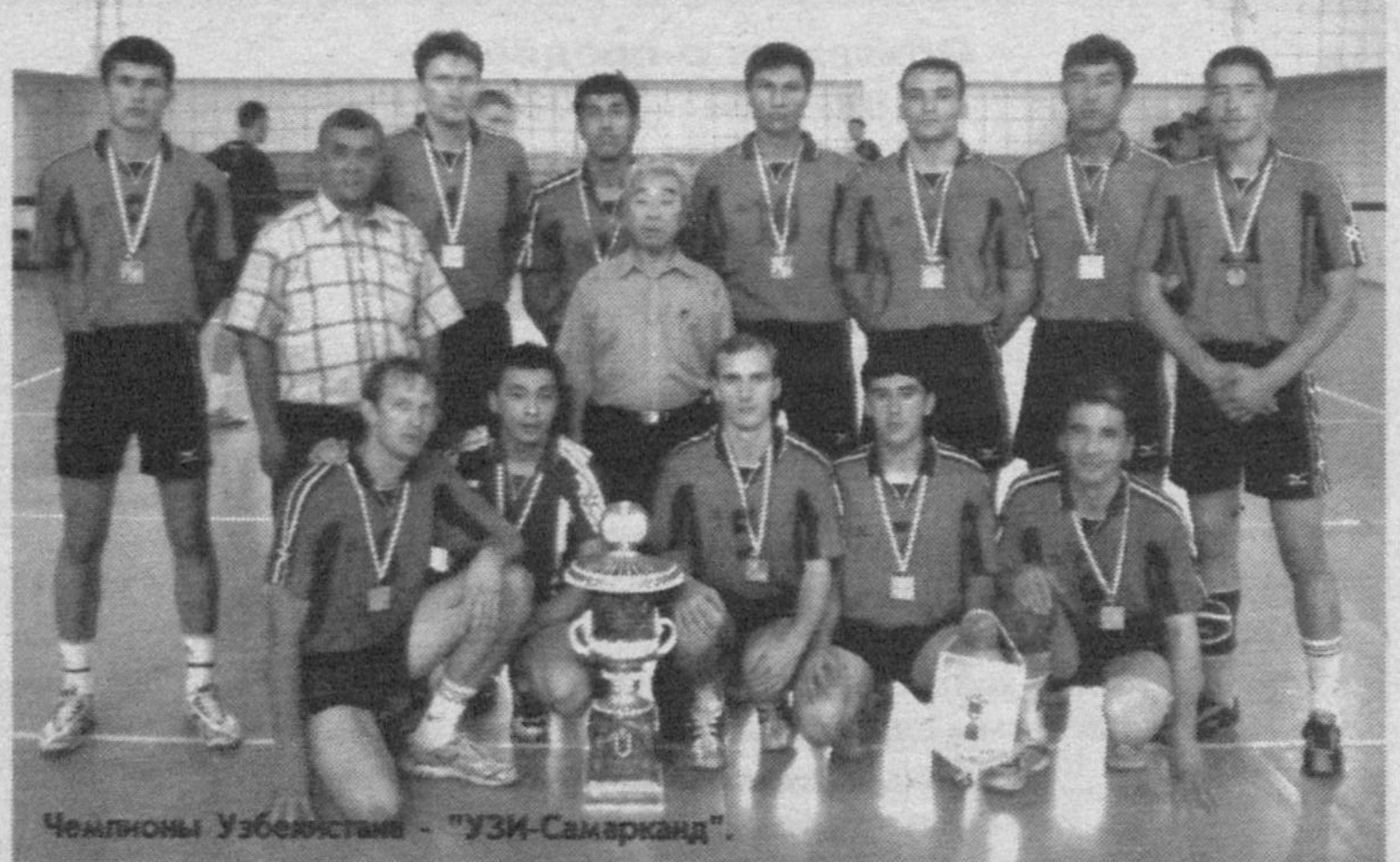
Чемпионы Узбекистана - "УЗИ-Самарканд".

пятое место между наманганским "Динамо" и студенческим клубом КГУ (Каракалпакский госуниверситет), - продолжил Пулатов. - В первый день с минимальным преимуществом выиграли динамовцы в пяти партиях, во втором матче - такой же итог, но уже в пользу нукусских волейболистов. И лишь в решающем поединке КГУ сломил сопротивление вкопец уставших наманганцев - 3:1. Четырнадцать партий (!) сыграли соперники. Рекорд первенства.