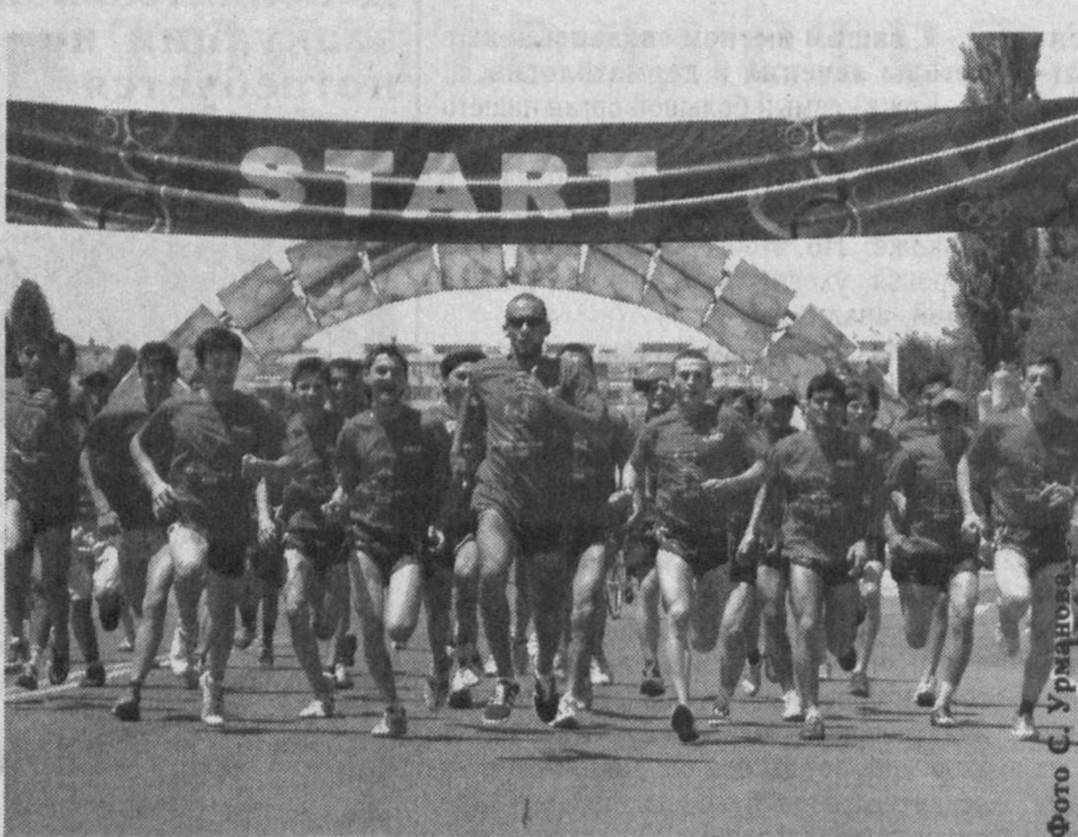
В Национальном парке имени А.Навои прошли финальные соревнования Олимпийского дня бега, ежегодно проводящегося в 200 странах мира.