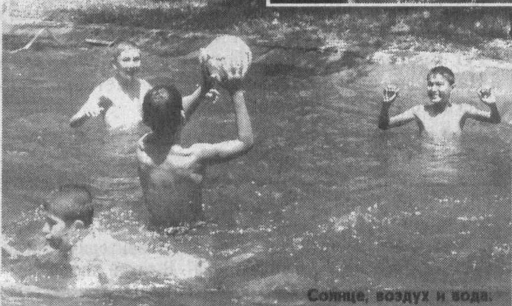
Солнце, воздух и вода.

баню с душевыми кабинками. Но с условием - здесь будет отдыхать на каникулах детвора.