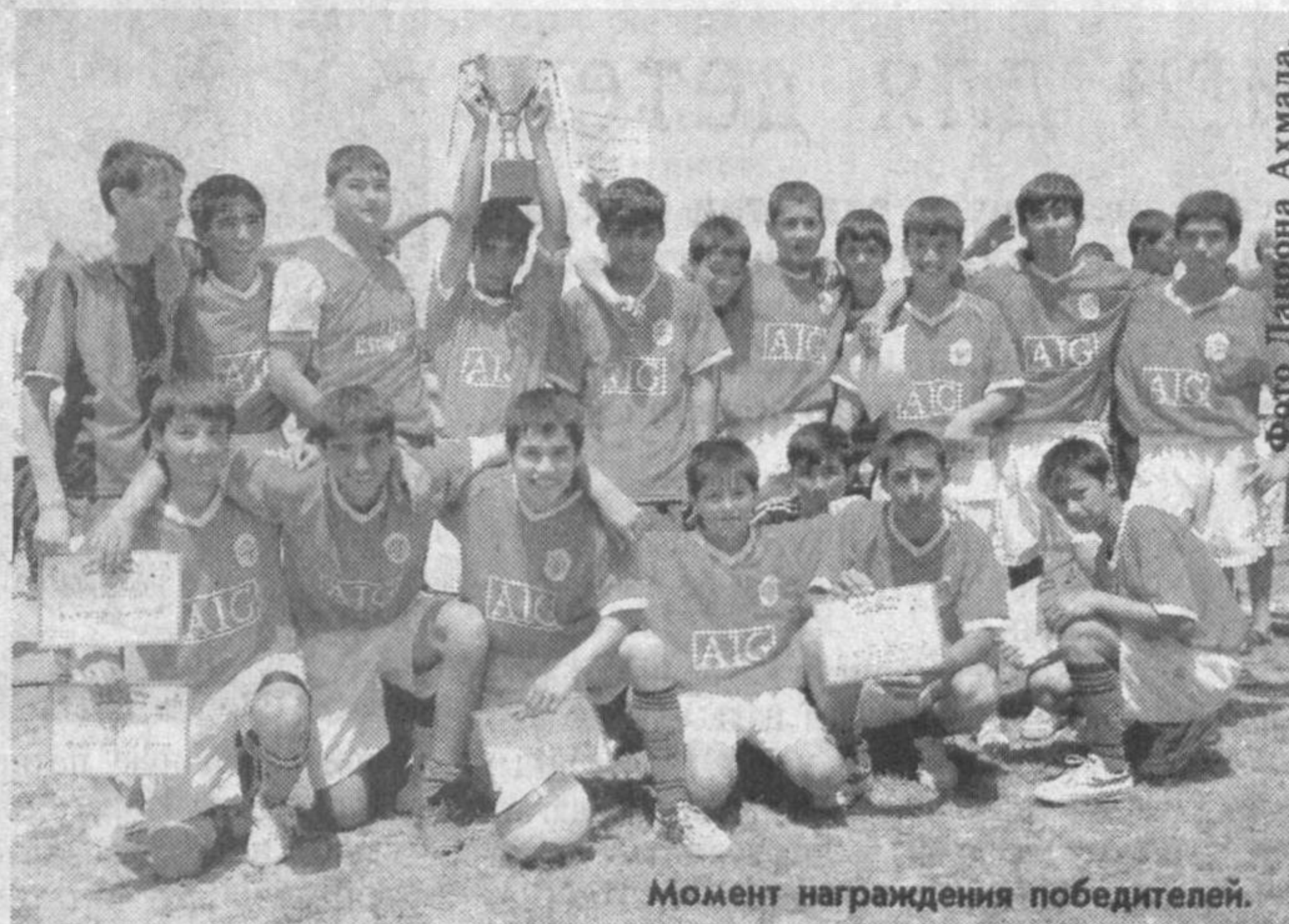
Момент награждения победителей.