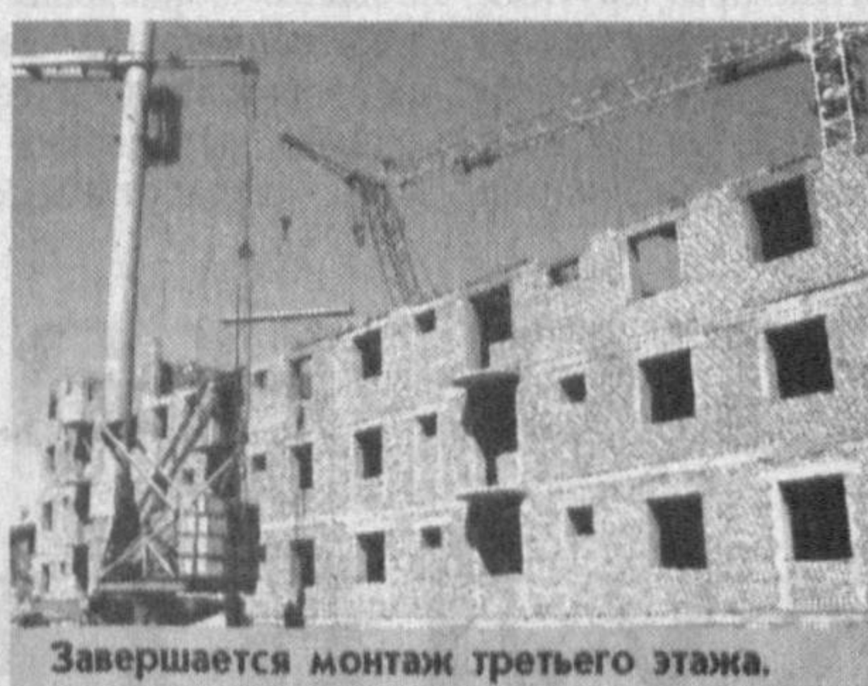
Завершается монтаж третьего этажа.

В феврале унитарным предприятием "Кашкадарькурильшмонтажсервис" начато строительство дома для молодых семей. Квартиры предоставляются на условиях льготного ипотечного кредита. Новоселье в канун главного праздника страны - Дня независимости.