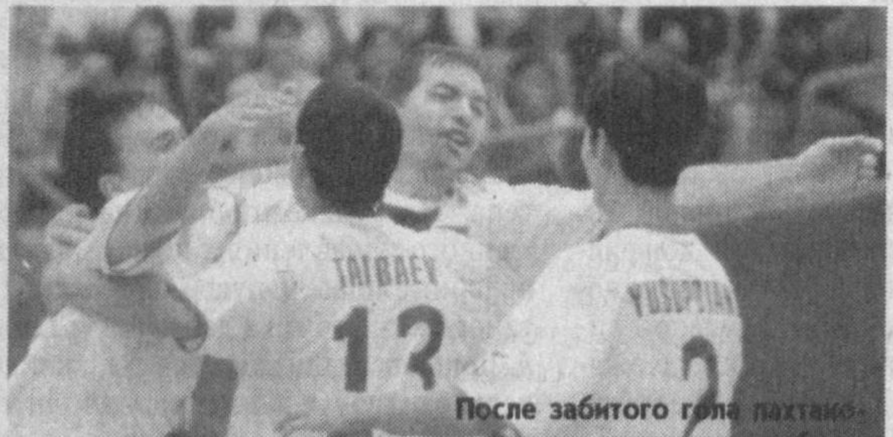
После забитого гола пахтакорцы празднуют победу.

Тимур Низиев. Обозреватель "Правды Востока".