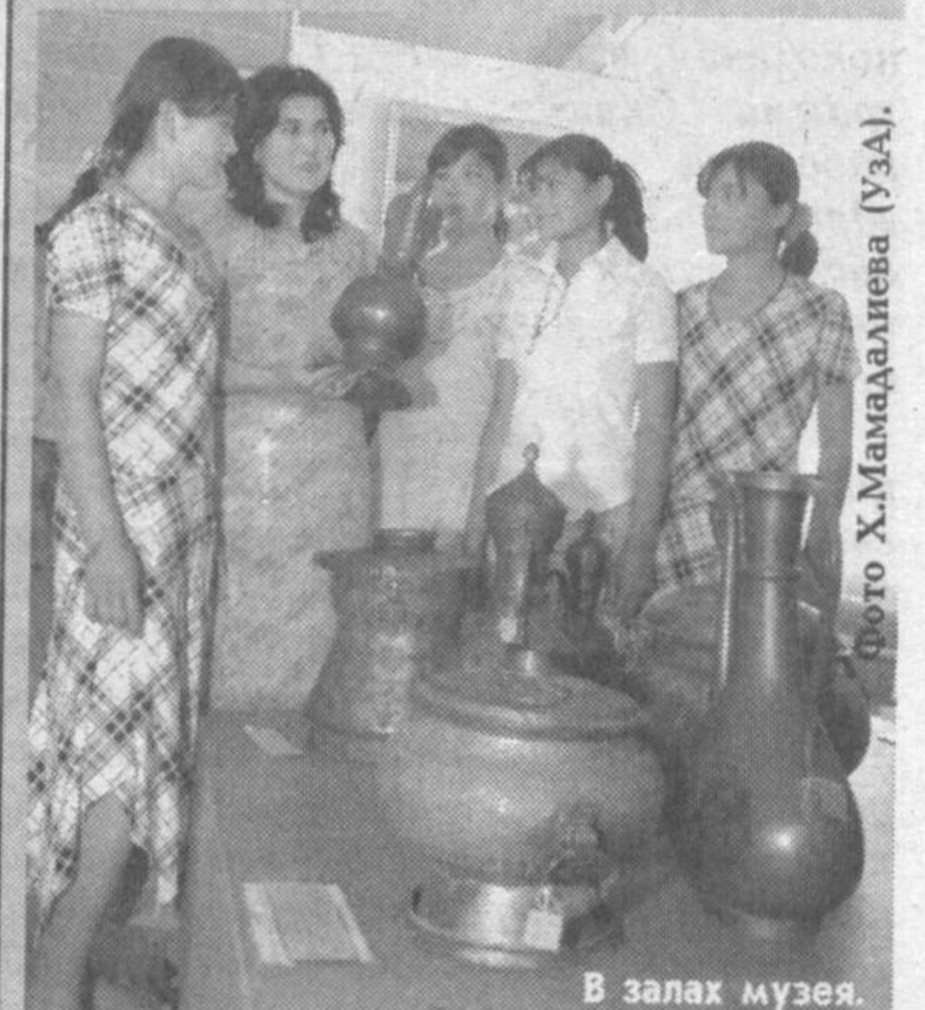
В залах музея.

На фестивале музеев Узбекистана, посвященном 2000-летию города Маргилана, Наманганский областной краеведческий музей был признан победителем в номинации "Обладатель самого уникального экспоната по истории Узбекистана".