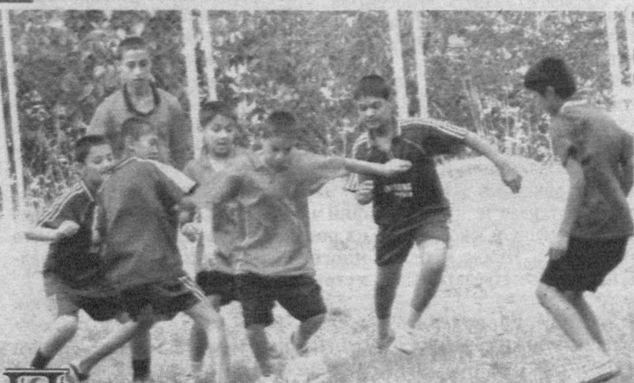
В лагере имени Ахата Азизкориева.