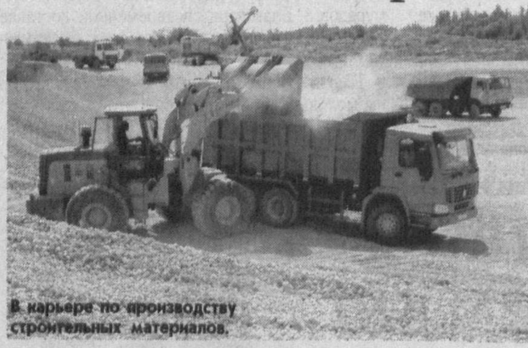
В карьере по производству строительных материалов.