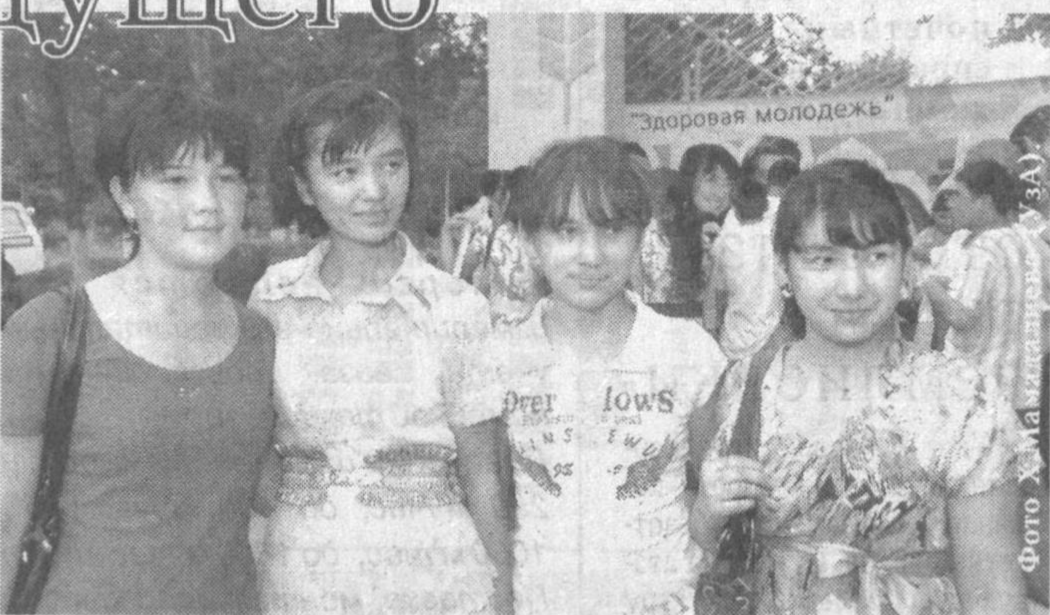
А. Саттаров. Корр. УзА.

В программу молодежного форума вошли различные игры, конкурсы и викторины, победители которых были награждены организаторами акции. Песни и мелодии в исполнении известных деятелей искусства подарили участникам мероприятия праздничное настроение.