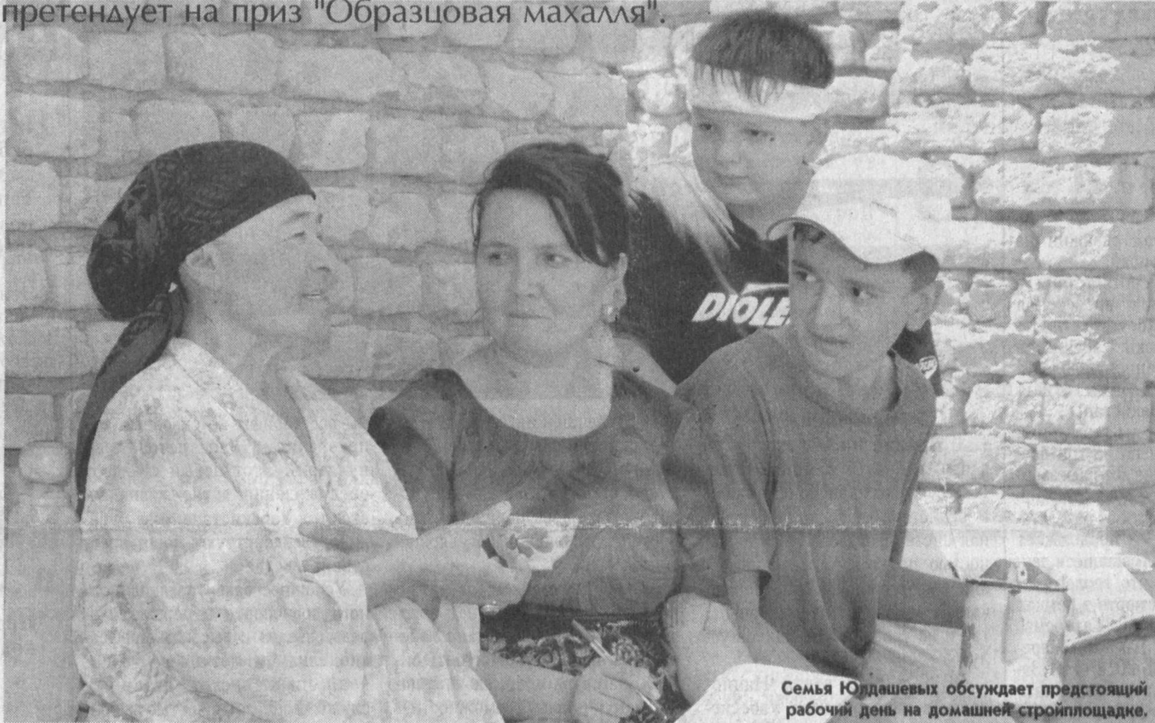
Семья Юдаевых обсуждает предстоящий рабочий день на домашней стройплощадке.