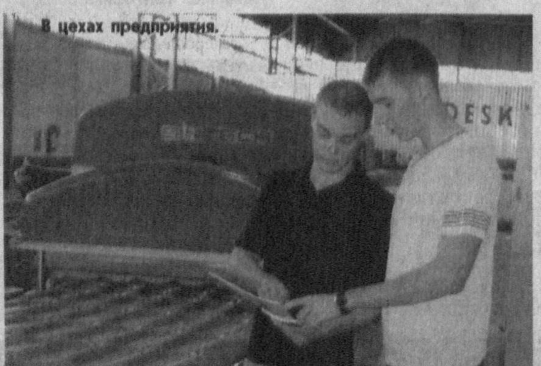
В цехах предприятия.