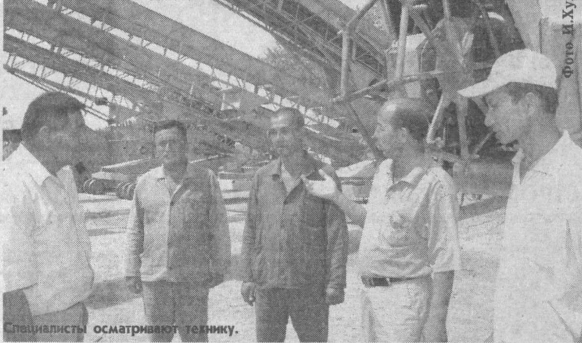
Специалисты осматривают технику.