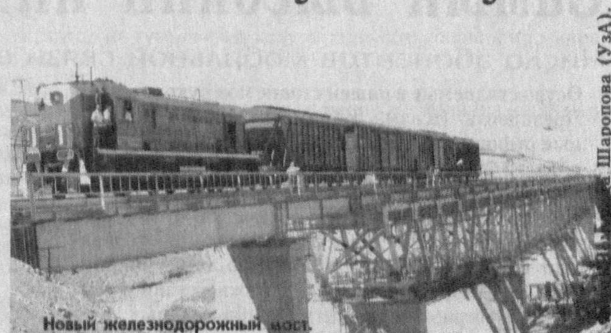
Новый железнодорожный мост

Железная дорога Ташгузар-Байсун-Кумкурған - одно из крупнейших сооружений, возведенных за последние годы.