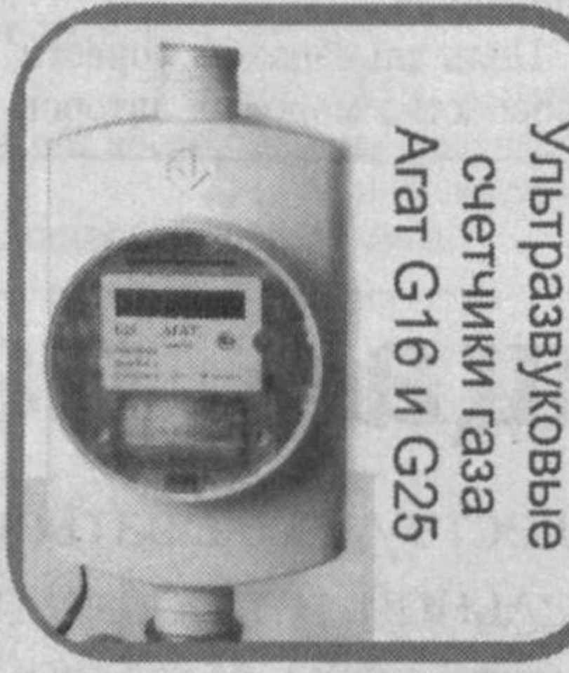
Ультразвуковые счетчики газа Агат G-16 и G-25

которые являются современными электронными приборами учета газа, произведенными в России.