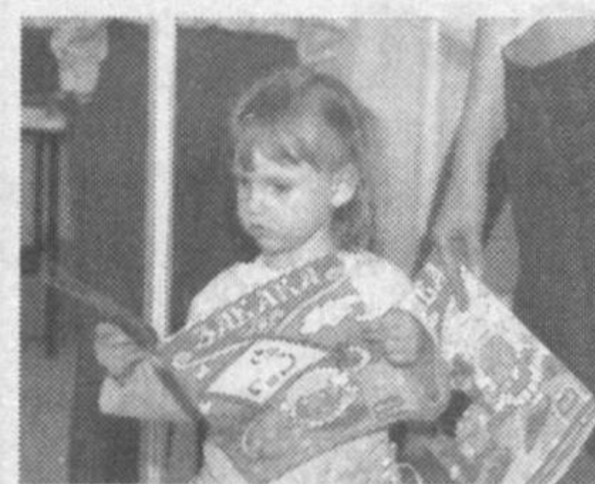
В рамках "Праздника чтения-2008" прошли читательские конференции, встречи с

Ставший уже традиционным проект ставит своими задачами привитие интереса и любви к чтению, развитие информационной культуры как основы информационной культуры общества. Целевая аудитория - все слои населения, но в первую очередь молодое поколение, в духовно-нравственном воспитании которого информационно-библиотечные центры играют немаловажную роль.