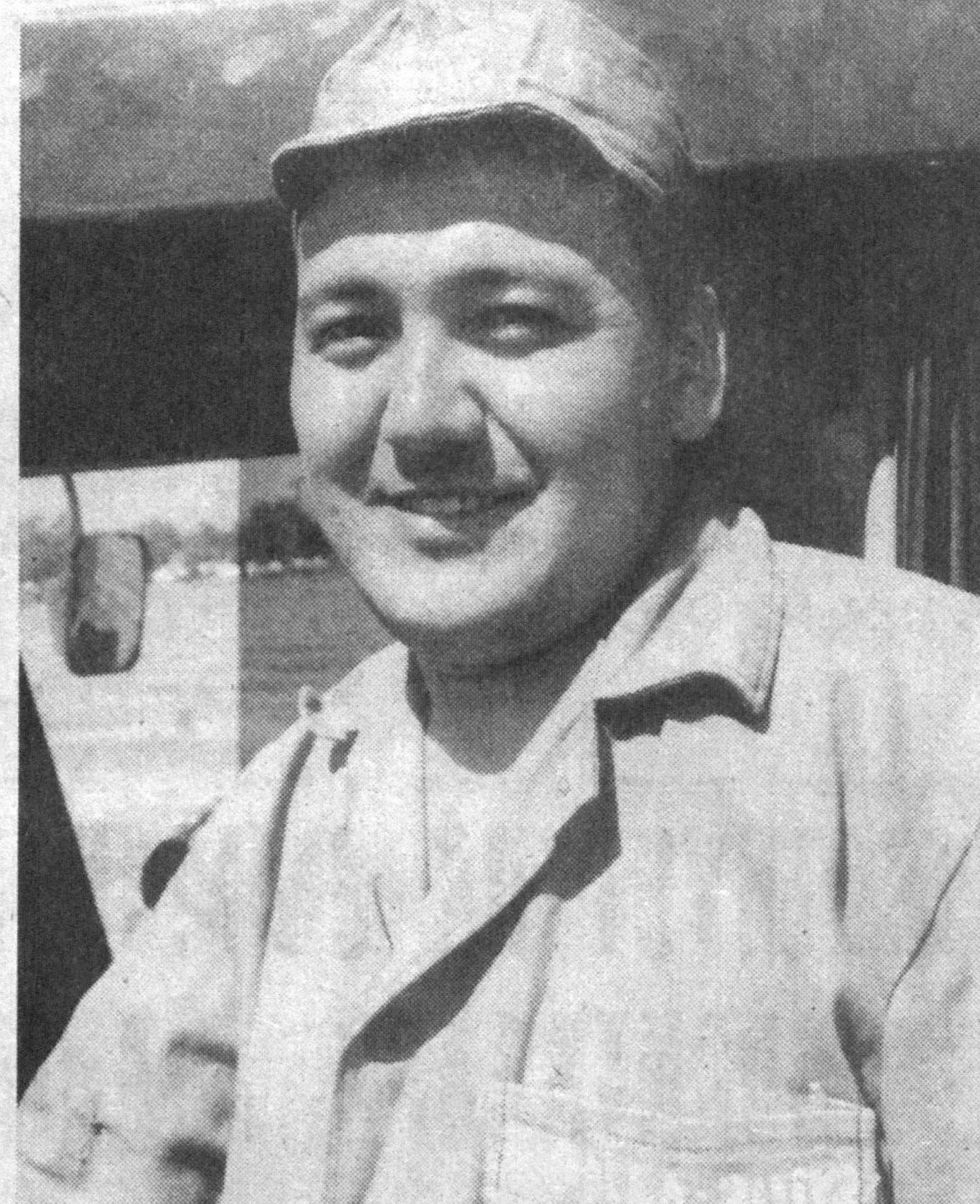
Ўрнимда фаол иштирок этаётган механизаторлардан бири.

Ҳозирги бозорларимизни бундан ўн беш-йигирма йил олдинги бозорларга қийслайман. Илгари ўз махсулотингизни эркин сотолмас эдингиз. Томорқангизда етиштирилган мева ёки сабзавот ва поллиз махсулотларини сотмоқчи бўлсангиз, аввало томорқангиз борлиги ҳақида, шу махсулотни ўзингиз етиштири-