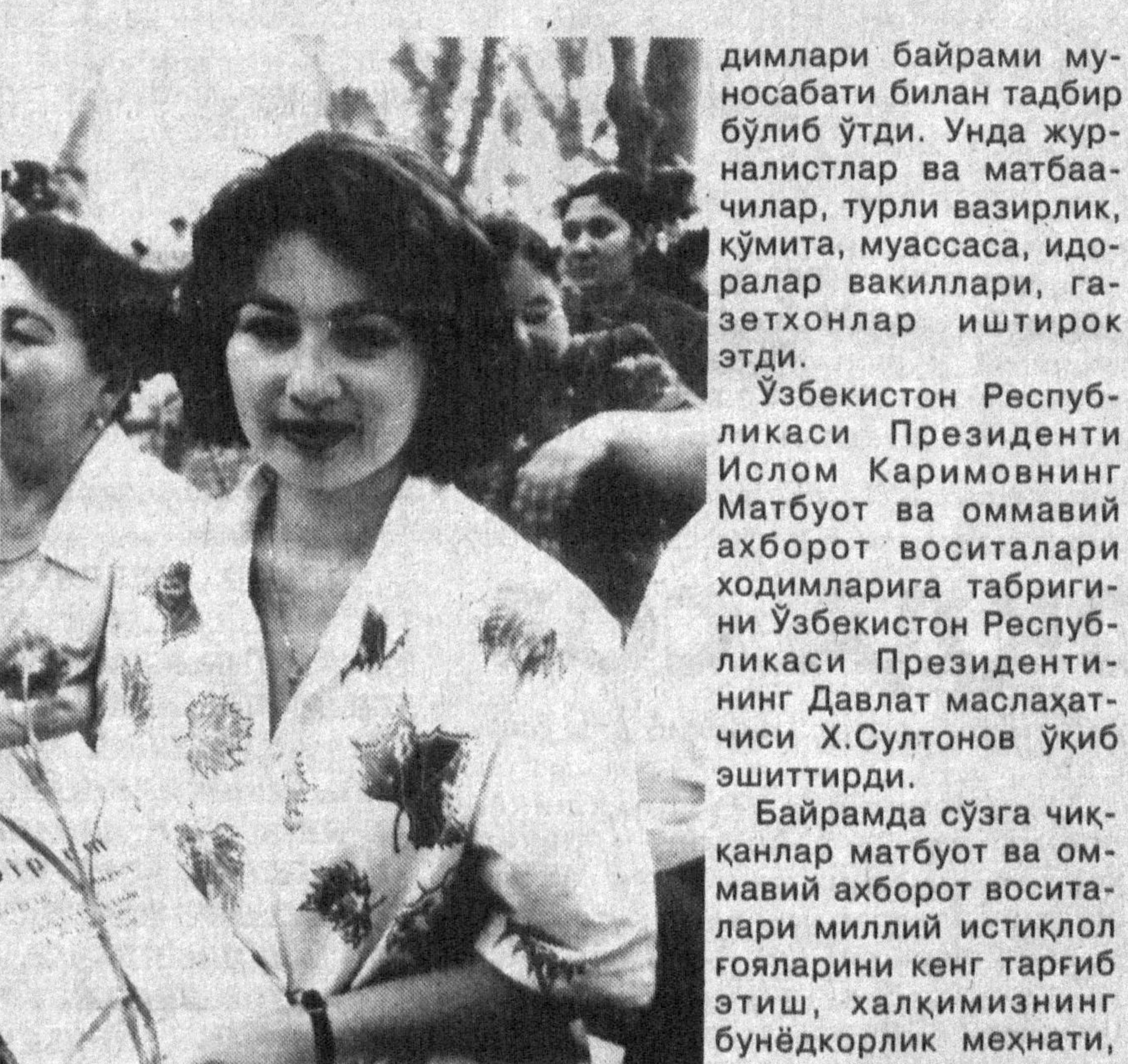
Пойтахтимизнинг Мирзо Улўғбек номидаги сўлим боғида 27 июн - Матбуот ва оммавий ахборот воситалари хо-

Бугунги кунда оммавий ахборот воситалари жамиятимиздаги ижтимоий-сиёсий, маънавий-руҳий ўзгаришлар, демократик тамойилларни шакллантиришдек улўғвор ишларнинг фаол иштирокчиси, одамларимизни эркин фикрлашга ўргатадиган ва маънавий ўйғокликка даъват этадиган доимий ҳамроҳимизга айланаётир. Бунинг замирида, шубҳасиз, журналистларимизнинг ўз касбига меҳр ва садоқати, оғир ва сермашаққат меҳнати мужассамдир.