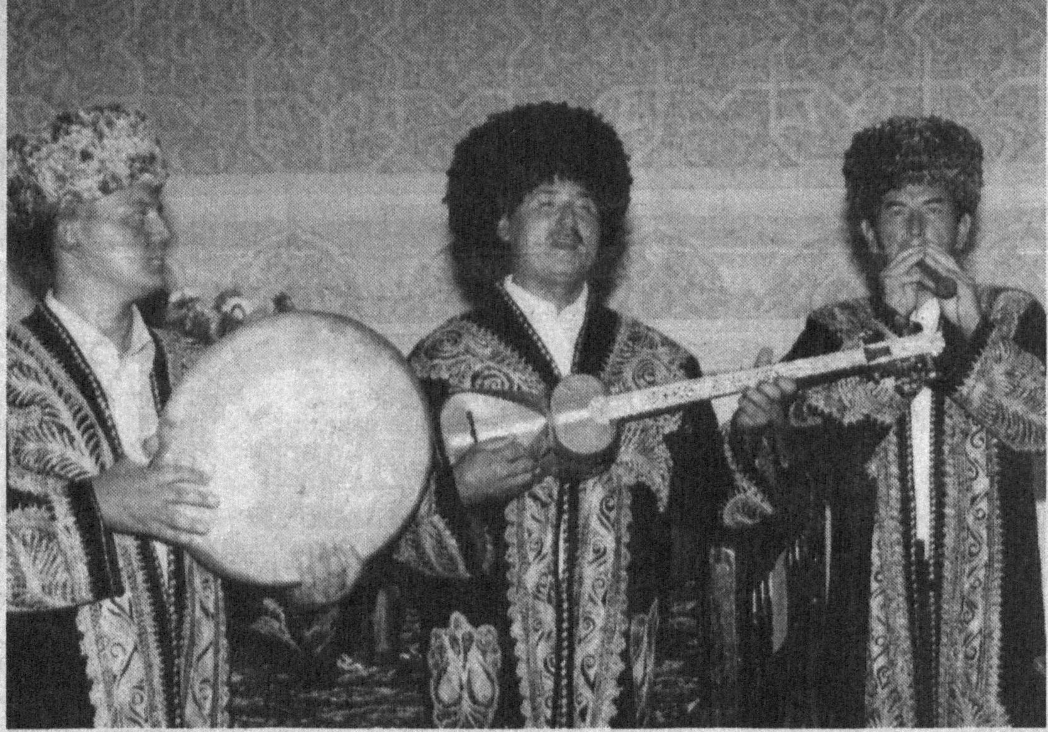
Таралади қўшиқ куйга чулғаниб...