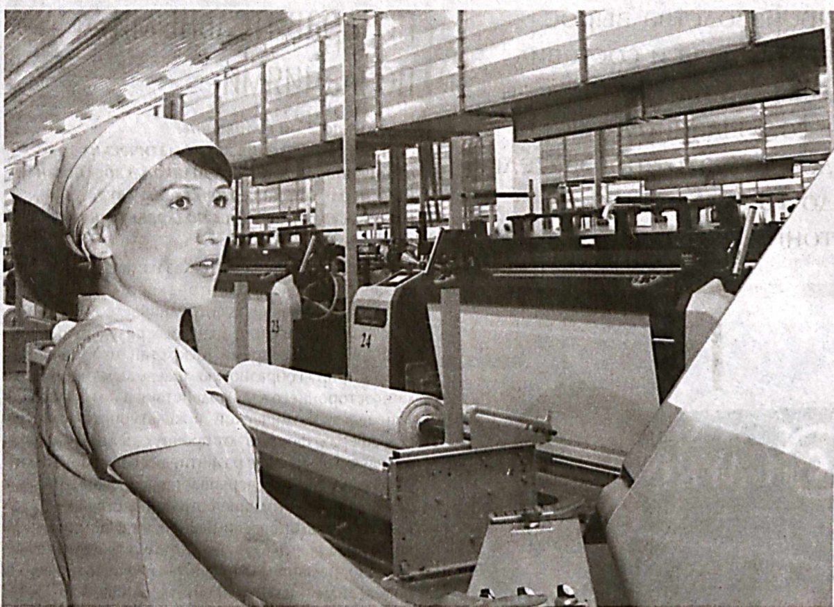
СП ООО "Сурхонтек", открытое в Джаркургане Сурхандарьинской области, занимает лидирующие позиции по выпуску и продажам текстильной продукции на рынке Узбекистана и входит в число основных экспортеров в такие страны, как Россия, Казахстан, Украина, Беларусь, Польша, Бельгия, Чехия, Китай и Турция.

Совместное предприятие перерабатывает хлопок и производит пряжу - пневмопрядильную, кардную, гребенную, а также тканые полотна шириной до 267 см (бязь, миткаль, сатин). Выполняет отделочные, набивные и пошивочные услуги по индивидуальным пожеланиям и требованиям заказчиков. Словом, сырье здесь становится практически готовой продукцией с высокой добавленной стоимостью.