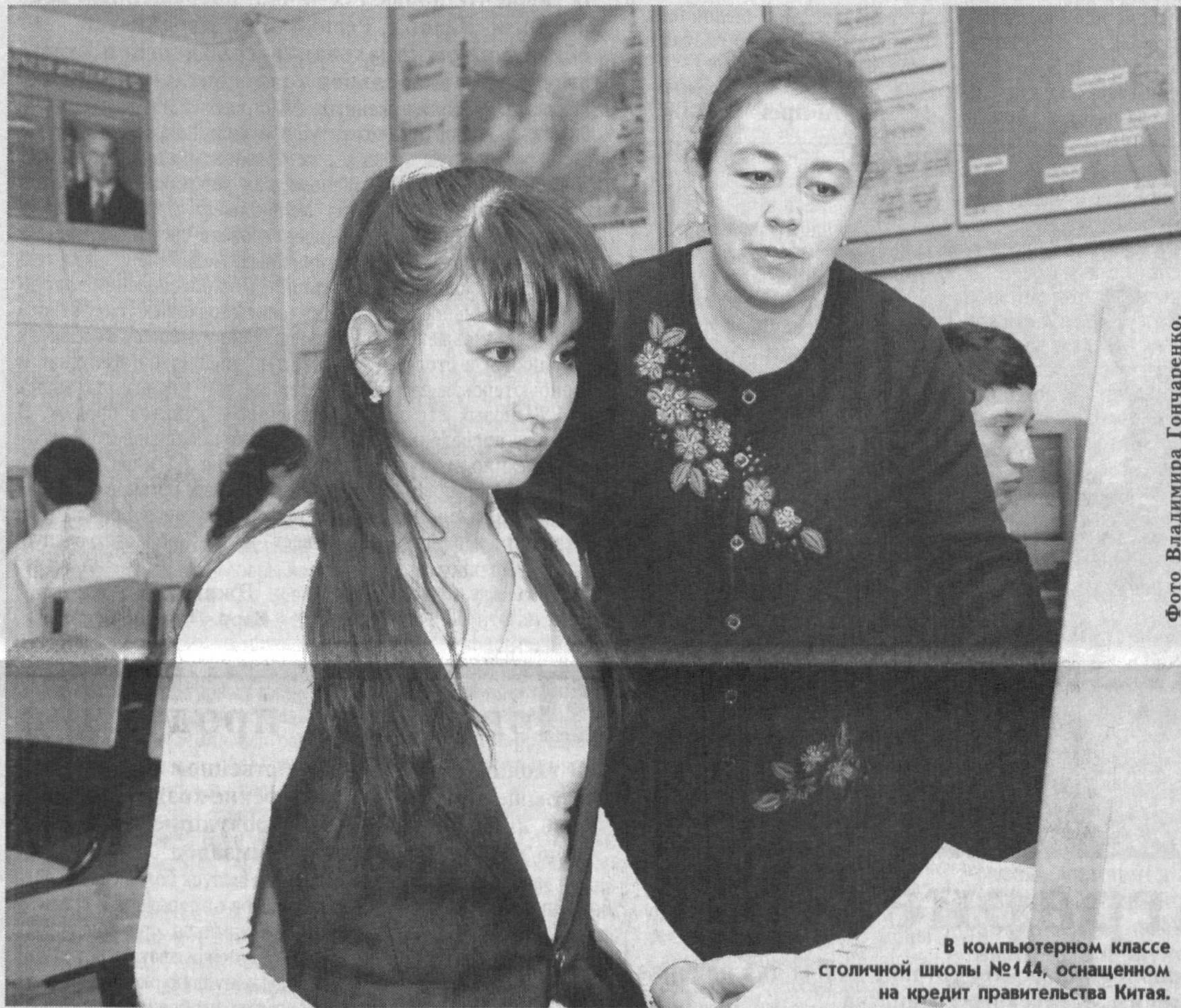
В компьютерном классе столичной школы №144, оснащенной на кредит правительства Китая.