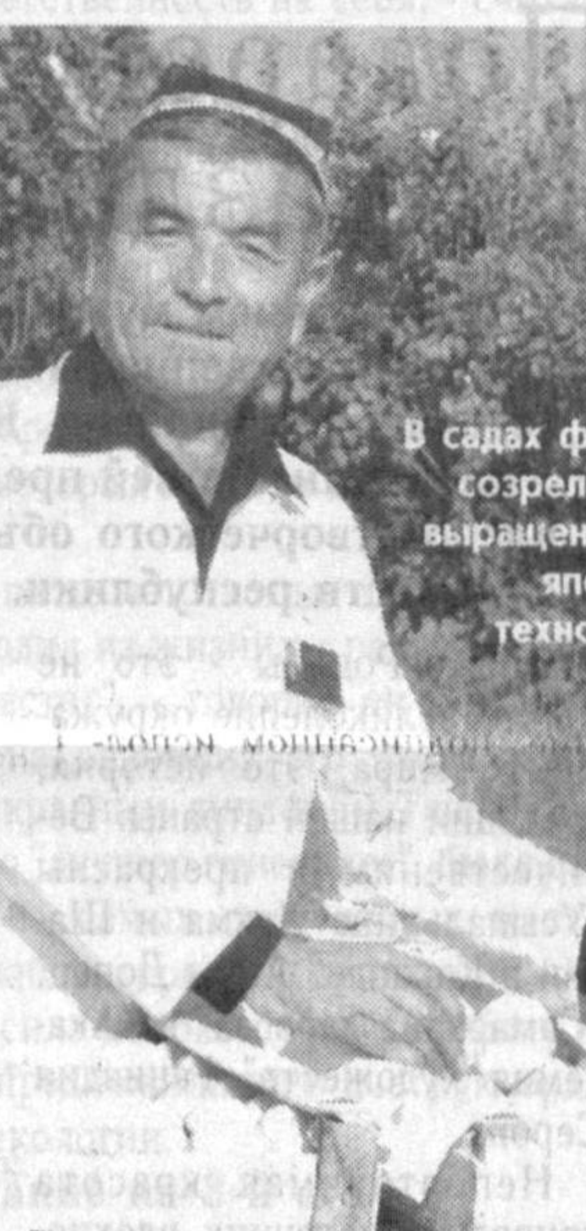
В садах филиала созрела айва, выращенная по японской технологии.

Здесь созданы приемлемые условия для проведения