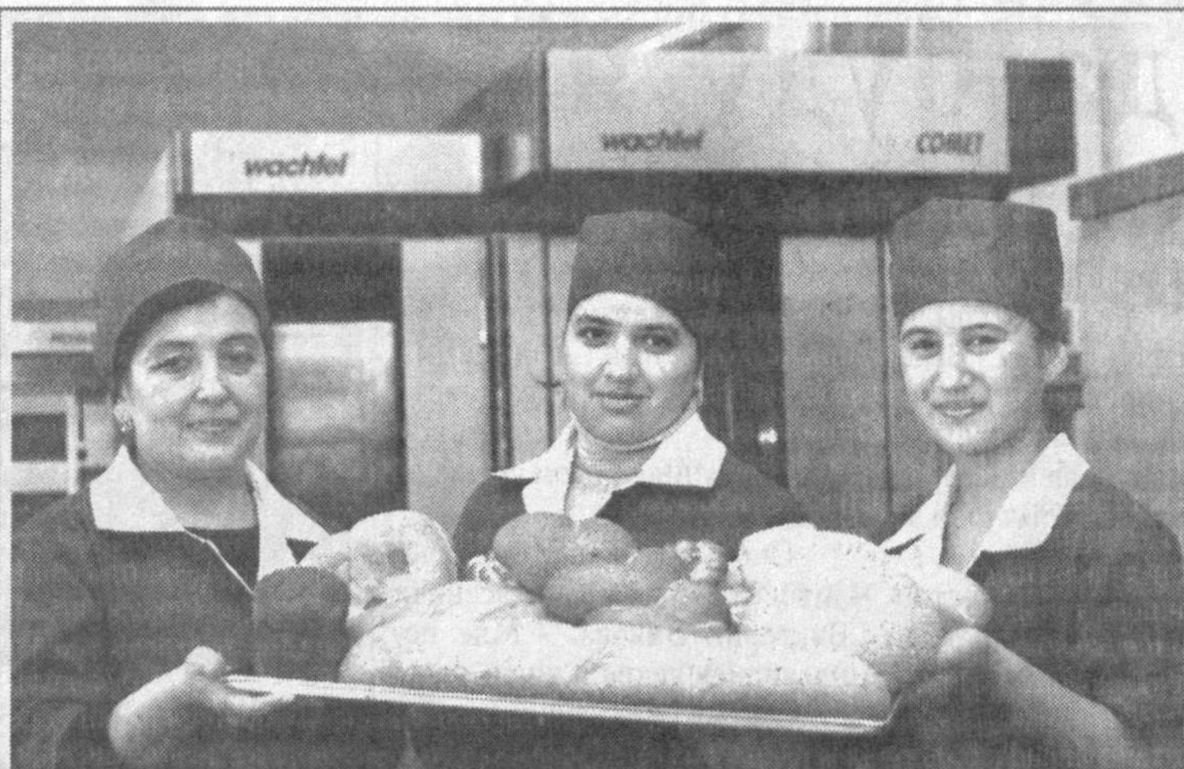
Чудо-печи от «Винклер-Вахтель»

Стоит также отметить, что вполне оправданными являются проводимые в Узбекистане в переходный период методы государственного регулирования. Устойчивый рост экономики и сравнительно малые потери Узбекистан от воздействия мирового финансового кризиса, надежность финансово-экономической и банковской систем вызывают всеобщее одобрение. ИА "Жахон".