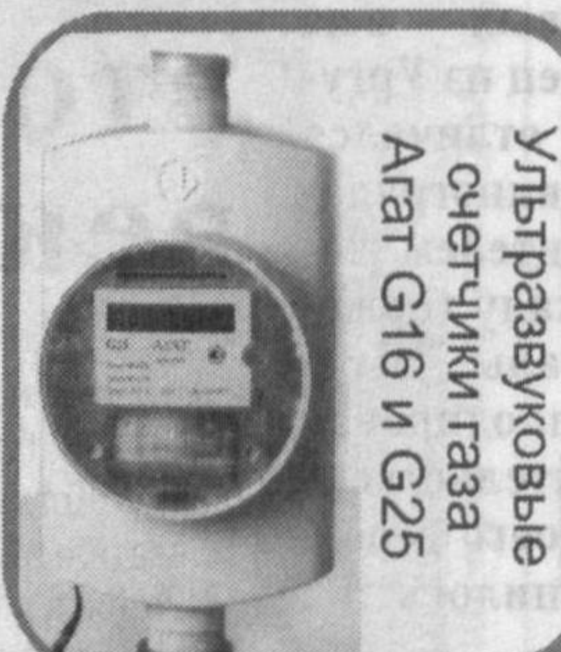
Ультразвуковые счетчики газа Агат G16 и G25

которые являются современными электронными приборами учета газа, произведенными в России.