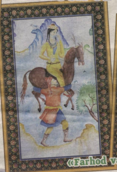
«Farhod va Shirin»