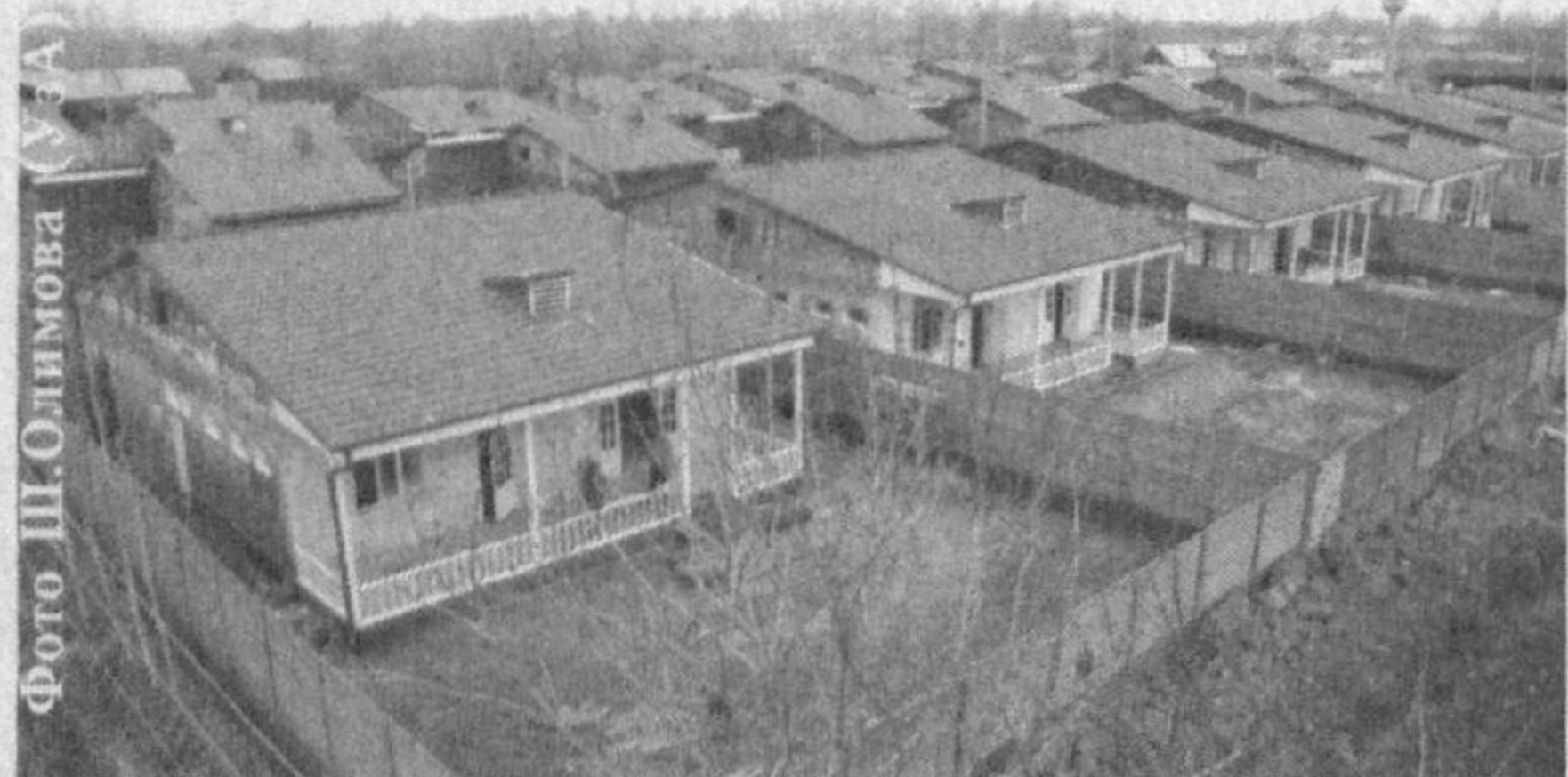
На территории махаллинского схода граждан "Иттифок" Алтынкульского района сданы в эксплуатацию двадцать новых домов, построенных на основе типовых проектов.

В стране осуществляется масштабная созидательная работа по улучшению сельской инфраструктуры, формированию современного сервисного обслуживания и благоустройству сел.