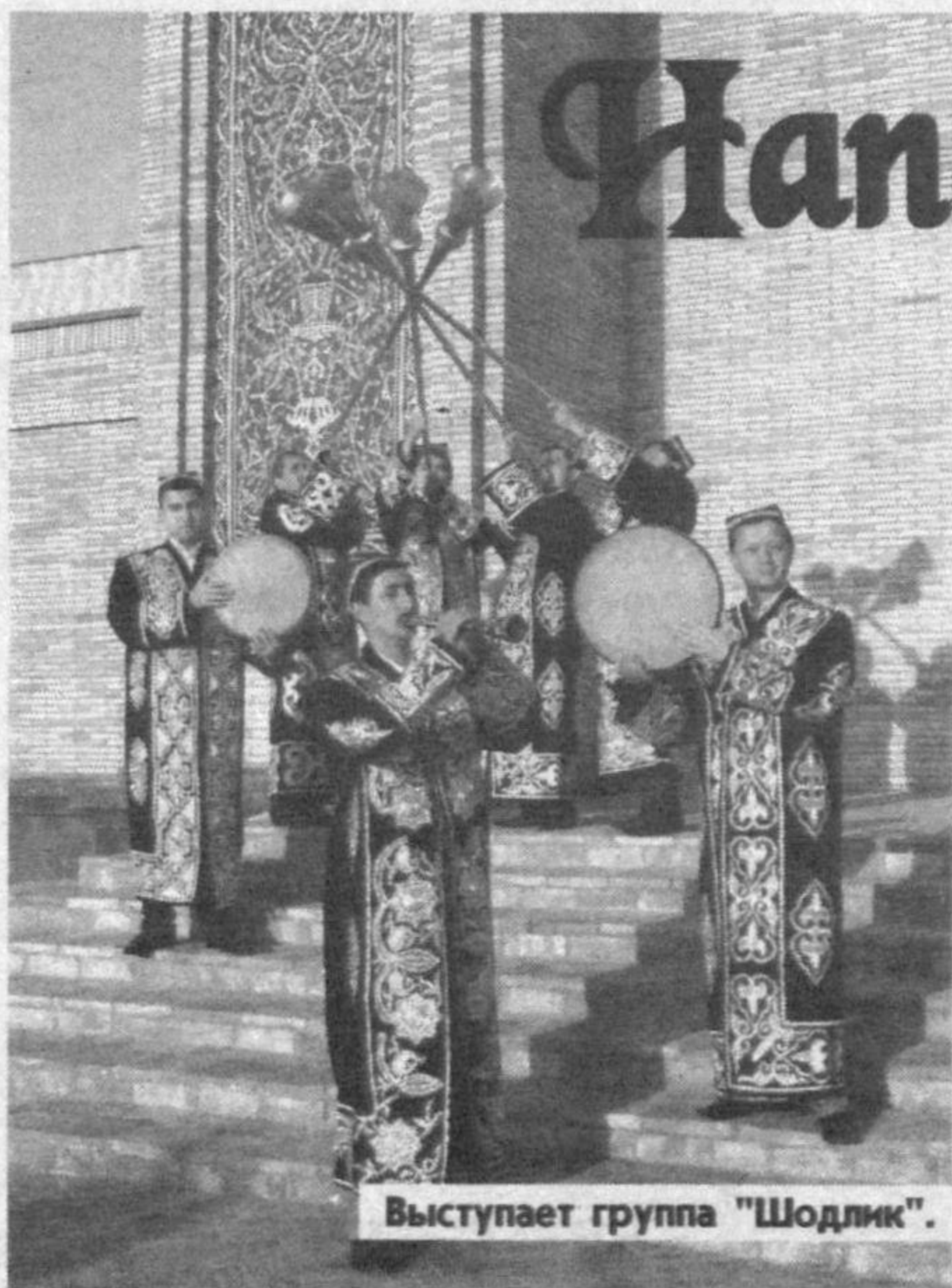
Выступает группа "Шодлик".

При поддержке музея "Миллий чолгу" при Государственной консерватории Узбекистана "Правда Востока" начинает цикл публикаций, которые помогут и нашим читателям глубже окунуться в удивительный мир национальных инструментов. И первый наш рассказ о духовых инструментах.