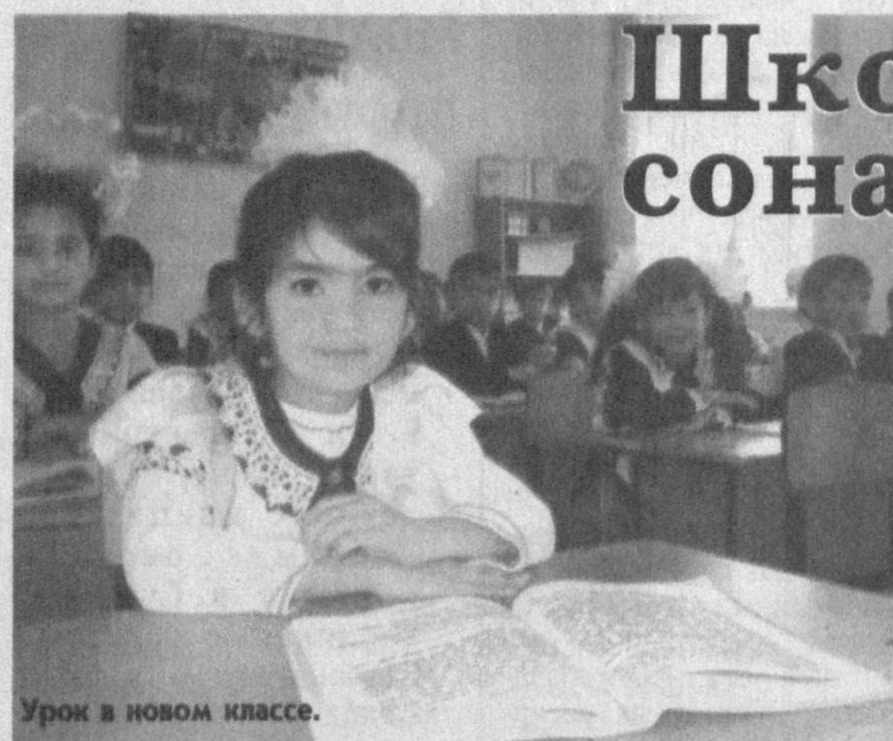
Урок в новом классе.

Еще бы - закончен капитальный ремонт второго учебного корпуса, благоустроена территория - школу теперь просто не узнать! Более того, она готова перейти на занятия в одну смену.